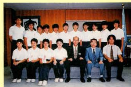
全国中学校体育大会出場 郡中学校バレーボール部（女子）・剣道部（女子個人）の皆さん