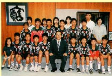
全九州小学生バレーボール男女優勝大会出場 福重バレークラブの皆さん