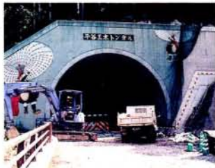
建設が進む平谷黒木トンネル