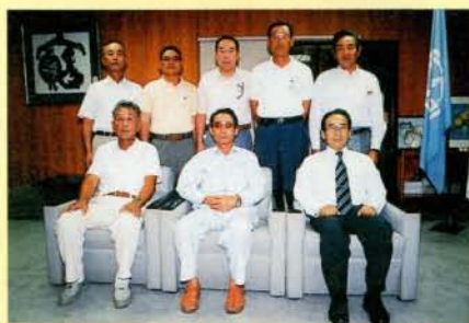
西日本実年ソフトボール選手権大会出場 大村球友クラブの皆さん