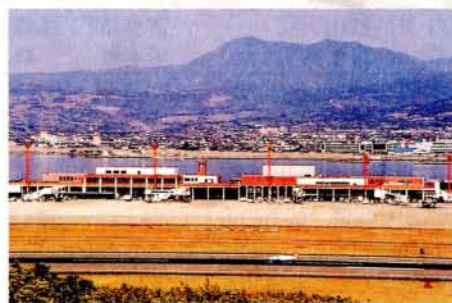
花文字山から長崎空港・市街地を望む

この長崎空港の生みの親である箕島は、標高97mの南島と標高42mの北島からなる周囲7km、面積約90万㎡のひょうたん型の島で、13世帯、66人が住み、主に農業を営み、小学校の分校もある400年近い歴史をもった島であったといえます。この島を造成して、面積157万㎡・滑走路3000m