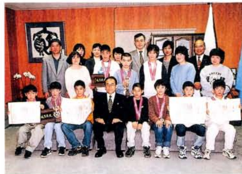
第40回全国選抜少年剣道練成大会に出場。みごとパート優勝した大村剣道協会チームと準優勝した微神堂チームの皆さん。(4/7・市役所)