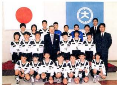
第5回九州少年サッカー新人大会に出場した放虎原サッカースポーツ少年団の皆さん。(3/25・市役所)