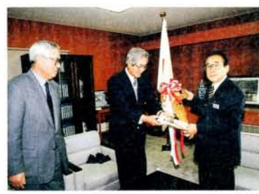
4月1日、大村コンクリート(株)から地域貢献の一環として市の高齢者福祉事業のために軽自動車の寄贈がありました。介護保険の訪問調査等のために活用させていただきます。