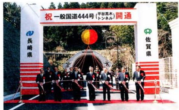
開通式でのテープカット

今後、開通を契機として、両市のイベント、観光等の情報交換を積極的に行い、相互の理解と連携を図っていきます。