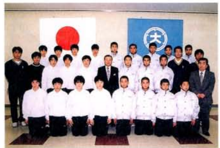
第16回九州中学校バレーボール選抜優勝大会に男子、女子アベック出場した郡中学校バレーボール部の皆さん。(3/25・市役所)