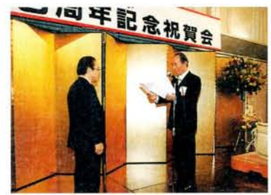
3月20日、(株)赤水創立50周年を記念し保健福祉センターへ軽自動車1台を寄贈されました。福祉向上のため、活用させていただきます。