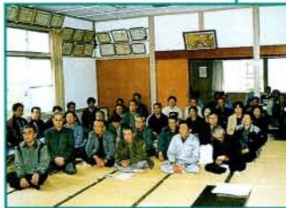
3/29・沖田町自主防災会の結成式