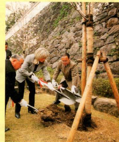
4/5・姉妹都市シントラ市長を迎えて記念植樹

姉妹都市であるポルトガル共和国シントラ市から、4月3日、シントラ市長ら28人が来訪。市長・議長を表敬訪問されました。一行は、7日まで滞在され、市内の視察や交流会などを行い、姉妹都市のきずなを深めました。