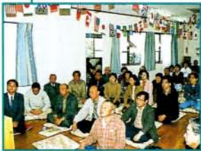
3/29・植松2丁目自主防災会の結成式