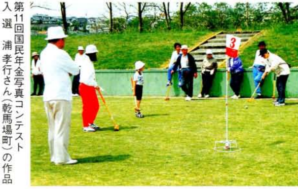
第11回国民年金写真コンテスト 入選 浦孝行さん（乾馬場町）の作品