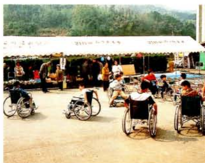
すずた福祉まつり

登録をしている人） ②在宅で、身体障害者手帳1・2級に該当する重度の身体障害者（児）または療育手帳A1・A2の精神薄弱者（児） ①②に該当する人と同居しており、かつ常時介護している