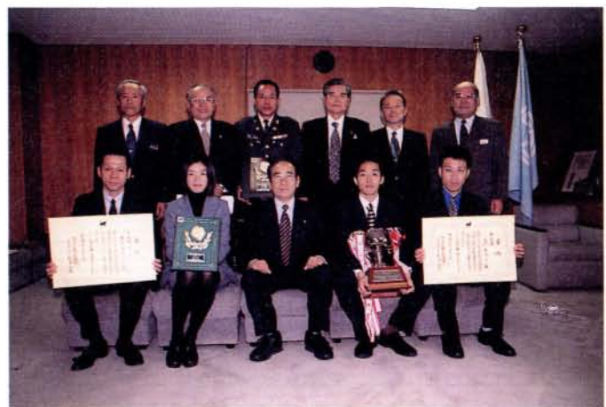
第50回記念郡市対抗県下一周駅伝大会で優秀な成績を収めた大村・東彼チームの皆さん(2/20・市役所)