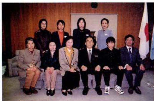
第42回KTN杯長崎県剣道大会で優秀な成績を収めた大村市銃剣道協会の皆さん(2/22・市役所)