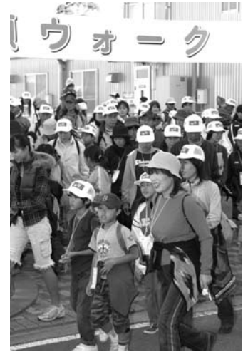
第5回 萱瀬ウオークの様子