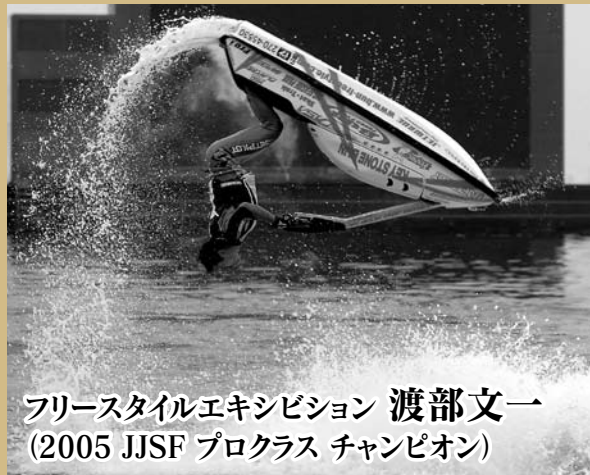
フリースタイルエキシビション 渡部文一 (2005 JJSF プロクラス チャンピオン)