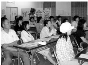
第2回子育て講演会のようす