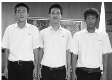
平成18年度全国高等学校総合体育大会で第3位に入賞した大村工業高校ソフトボール部の代表の皆さん (9月6日・市役所)