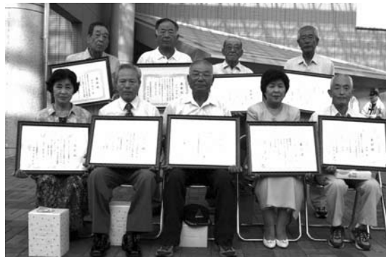
■問い合わせ 環境保全課 (内線144)