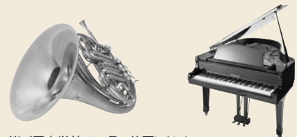
※桜が原中学校は、4月に終了しました。