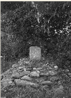
道脇にひっそりと建つ伝弥九の塚