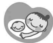
「マタニティマーク」

席を譲り、乗降時には協力する ・近くでの喫煙は控える ・「お手伝いしましょうか?」 のやさしい一言をかける