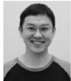
原作者 とやま 敏秀さん

この物語は、大村と彼杵に伝わる話をモチーフに、地元の人に話を聞いたり、昔の資料を調べたりして作り上げたお話です。私は昨年、市民ミュージカルの舞台に立ち、自分自身、大変楽しませてもらいました。その魅力に取り付かれ今回ペンを取ったのです。舞台の見どころは、ふるさとの大自然の中で暮らす人々の生き方や、主人公の男性二人の友情、女性とのラブロマンス…。まだまだ見どころいっぱいの物語を、また多忙の合間をぬって猛練習してきたみんなの舞台を、楽しんでご覧ください。