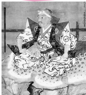
▲初代深澤儀太夫肖像画 ・現在の本陣付近