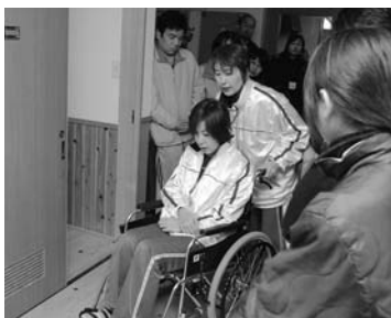
グループホームで消防訓練 (2/1 グループホームふぁみりい)

さらに、小規模福祉施設には設置義務のない「消防機関へ通報する火災報知設備」の設置を促進するため未設置の施設に対して、市単独の助成措置を行い、万一、同様の事故が発生しても被害を最小限に食い止めるための対策を講じることにしています。