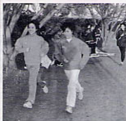
練習風景（西大村中グラウンド）

場して、大会新記録で優勝しました。この時初めて走る楽しさを実感しました。 今後の目標は？ 陸上競技は好きだから続けていきたいと思っています。今は西大村中学校陸上部キャプテンとして、チームが3月に開催される2年生最後の市中学校新人大会に出場してさっしり記録を残し、3年生につながる走りができることを目標に、みんな練習しています。