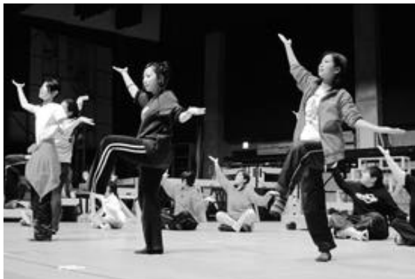
本番に向けての練習も着々と・・・

原作・出演・スタッフに至るまで、両市町の住民によって作り上げられた力作。6か月に及ぶ猛練習の集大成を、ぜひご覧ください。