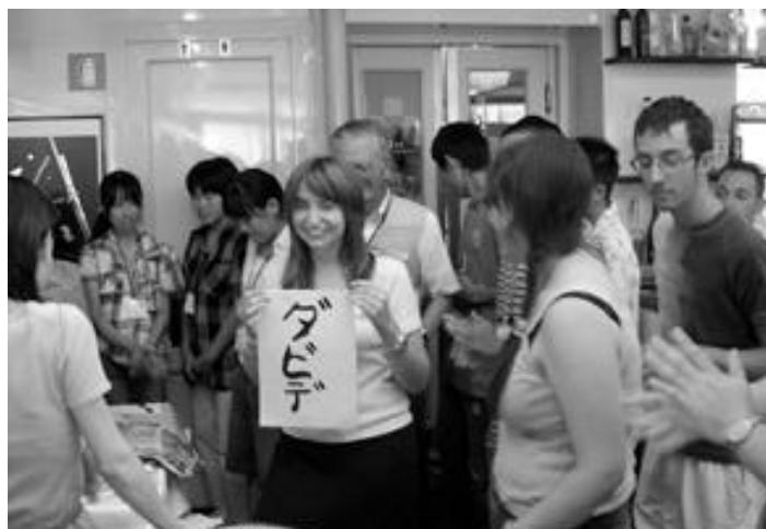
習字や折り紙などで、イタリアの学生と交流