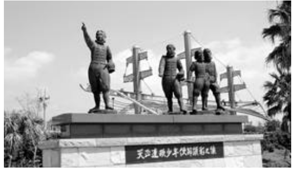
長崎空港出入口（森園公園内）にある天正遣欧少年使節顕彰之像