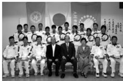
第60回国民体育大会秋季大会に県 選手団の一員として出場する大村市 関係の監督・選手の皆さん (10/6・コニヤ)