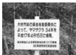
ヤマザクラの植栽 （緑の森公園）