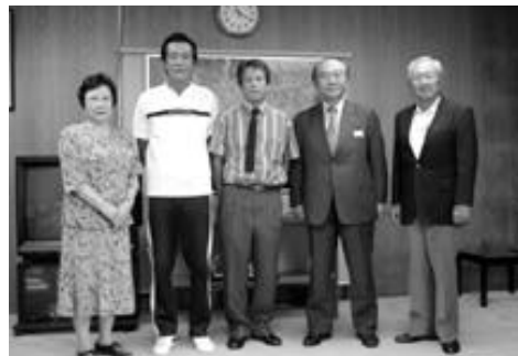
第2回九州一般男子ソフトボール 大会に出場する翼クラブの監督・選 手の皆さん (10/3・市役所)