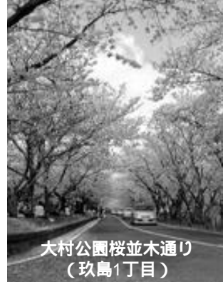
大村公園桜並木通り （玖島1丁目）