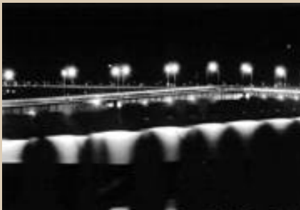
「箕島大橋夜景」 岸川仁之（赤佐古町）