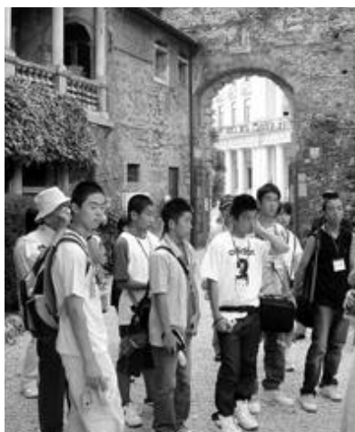
4少年の足跡をたどりながら、イタリアの各地を視察する一行