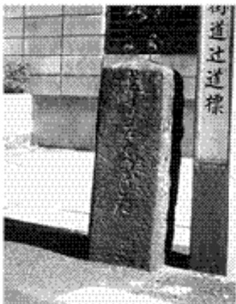
◆江戸時代から残っている辻道標

また、そこから、さらに200mほど進んだ交差点にも、道標が見 られます。これには「大村いとはや道」「まつうらその道」「かやせ かしま道」と刻まれ ています。刻まれて いる内容や「郷村記」 に書かれていないこ とから、先ほどの道 標よりも新しいもの と考えられます。 小さな石の道標で すが、街道の面影を 今に伝えるものです。