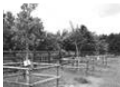
ケヤキ・クヌギなどの植栽 （高良谷牧場）

県へ納めた募金の一部は、緑の募金市町村緑化等事業として、市内の森づくりや緑化を推進するため植林、植栽に活用させていただきました。