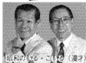
昭和の（左）・こし（右）（漫才）