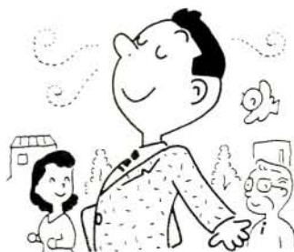
大気汚染防止推進月間

案内書配布 12月5日(火)から 申込期間 12月12日(火)〜14日(木) 問い合わせ 長崎県住宅供給公社 大村事務所(☎526825) 入居予定者の決定 応募者が募集戸数より多い場合は、公開抽選により決定します。 入居予定時期 12月下旬ごろから順次入居できます。