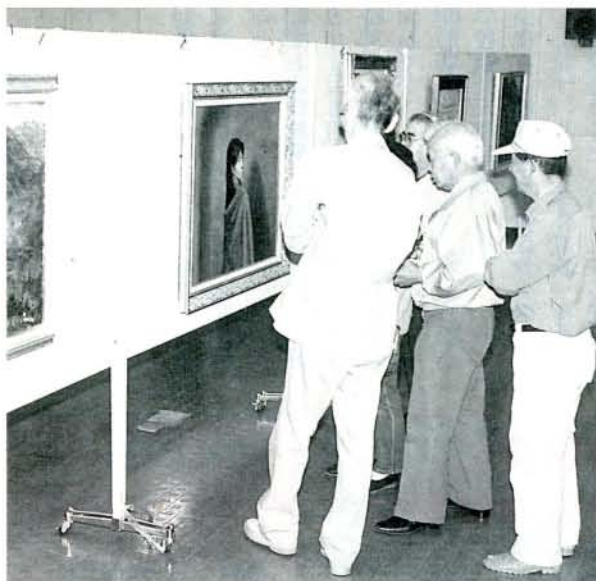
322点もの力作が展示された市美術展 (11/4・市コミセン)