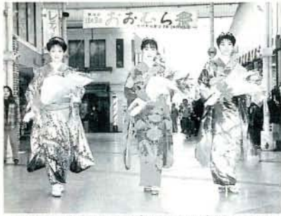
あてやかな振りそで姿がよくお似合いです

今回は、この1年間大村市の代表として、公式行事に花を添えていただく3人の方々にインタビューをしました。 内容は、①応募された動機 ②趣味や特技 ③将来の夢 ④理想の人(好きなタイプ) ⑤大村をアピールしたいところ ⑥抱負の6項目です。