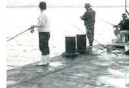
大物が釣れた「大村湾釣り大会」 (10/15・長崎空港周辺)