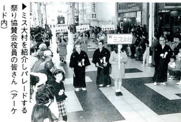
▶ミス大村を紹介しパレードする祭り協賛会役員の皆さん(アーケード内)