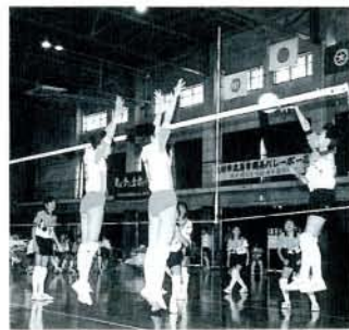
親睦がますます深まった「親善バレーボール大会」 (11/5・市民体育館)

大村・鹿島両市のスポーツ交流を通じて、相互の親睦と融和を図るとともに、国道444号の早期開通に向けての運動を推進しようと、大村市