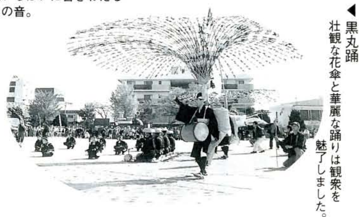
◀黒丸踊 壮観な花傘と華麗な踊りは観衆を魅了しました。