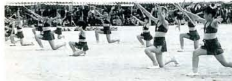
▲子どもバントワラーズ 見事なバトンさばきを披露するPL大村MBAの皆さん。