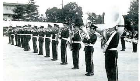
◀ブラスバンド 祭り広場は、大村部隊音楽隊のドリル演奏からスタートしました。