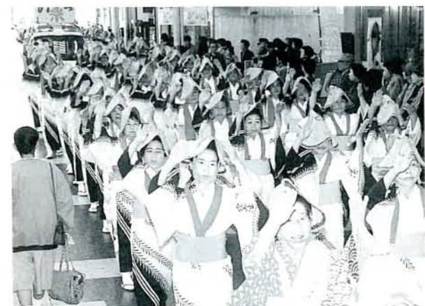
▲民踊道行 連合婦人会、民踊協会、民踊愛好会、農協婦人部の総勢300人が出演しました。