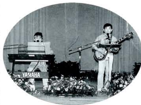
▶オープニングセレモニー(前夜祭) すばらしい演奏を披露した市内のアマチュアバンド「紙ねんど」の2人

秋を彩る「第34回おおむら祭り」が、11月2日(前夜祭)・3日(本祭り)と2日間行われ、大変なごきわいをみせました。 前夜祭は、市民会館で95ミス大村の選彰式や職場対抗歌合戦があり、埋めつくした会場を沸かせました。本祭りは、大村部隊の音楽隊を先頭に、カラーガード隊、チャリダー、リズムダンス、子どもバントワラーズ、民踊、日舞道行、ミス大村パレード、郷土芸能では今村浮立・黒丸踊・水主町ココデシヨ、樽みこしが次々に鶴亀橋を出発。沿道の声援を受けながら祭り会場(三城小グラウンド)へとアーケードを練り歩きました。祭り会場では、それぞれの団体が詰めかけた市民の前で演技を披露。趣向を凝らしたカーニバルもあり、子どもからお年寄りまでおおむらの祭りを満喫していました。