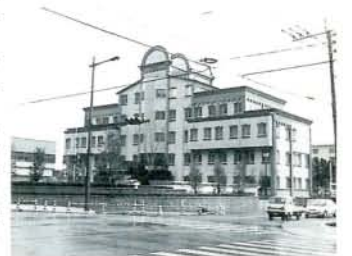
ゴシック風デザインの大村警察署新庁舎

大村警察署の庁舎は、老朽化が著しくなり、また手狭になったため、森園町の旧市民プール跡地に新しく庁舎を建設中でした。このたび、完成し移転することになりましたのでお知らせします。ただし、12月1日(金)までは、旧庁舎で業務を行います。 ※電話番号は従来通り ☎540110です。