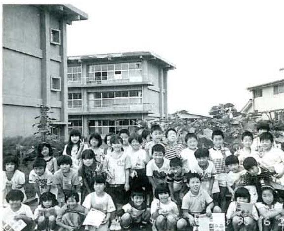
お互いに協力し合って「人権の花」を栽培した 竹松小学校3年生児童の皆さん(竹松小学校)

幸せに生きていく権利—これは日本国憲法で、すべての人に平等に認められた権利、つまり人権です。しかし、実際はどうでしょう。現代の複雑な社会環境のなかでは、学校でのいじめや体罰、男女差別、エイズ差別、外国人に対する差別など、人権を無視した行為が問題になっています。世界でも有数の経済大国になり、物質的に豊かになった半面、人への思いやりや気配り、連帯感などが薄れつつあるのではないのでしょうか。いま、こうした問題に目を向け、人権とは何か、人権の尊重とはどのようなものなのかを理解することが、わたしたち一人ひとりに求められています。 「人権週間」を機会に、もう一度人権について考えてみましょう。