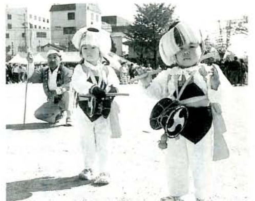
おおむら祭りより (11/3・三城小学校)

12月の大村ポート (2日~5日、8日~12日・歳末ドリームカップレース、 16日~19日、21日~24日・賞金王決定戦場外発売)