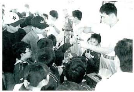
大村湾の汚染度検査などに 取り組む子どもたち (10/15・大村湾船上)

子どもたちに、大村湾を知ってもらおうと、市では大村湾をきれいにする会大村支部との共催で、10月15日に「大村湾観察クルージング」を行いました。