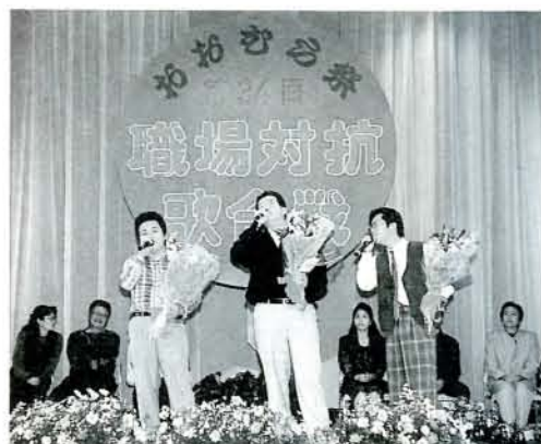
▲職場対抗歌合戦(前夜祭) 市内の職場から10チームが参加。3人の息もピッチリ、自慢ののどを披露しました。