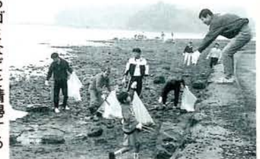
散乱するゴミなどを清掃する参加者の皆さん (10/29・大村公園先沿岸)

この日は小雨の降る天気でしたが、早朝から大村湾をきれいにする会、一般市民など約60人が参加。海岸に打ち上げられた漂流物や板切れ、空き缶などが捨集められました。