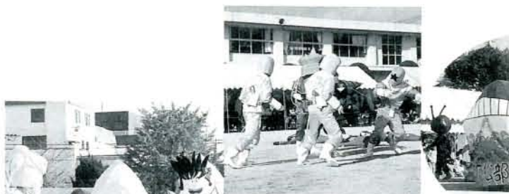
◀カーニバル 3部隊の趣向を凝した出し物に子どもたちは大喜び。