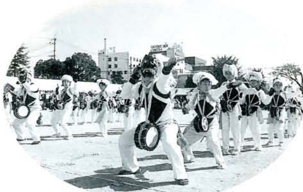
▲今村浮立 子どもから大人まで総出演。子や孫に伝授してほしい郷土芸能です。

秋を彩る「第34回おおむら祭り」が、11月2日(前夜祭)・3日(本祭り)と2日間行われ、大変なごきわいをみせました。 前夜祭は、市民会館で95ミス大村の選彰式や職場対抗歌合戦があり、埋めつくした会場を沸かせました。本祭りは、大村部隊の音楽隊を先頭に、カラーガード隊、チャリダー、リズムダンス、子どもバントワラーズ、民踊、日舞道行、ミス大村パレード、郷土芸能では今村浮立・黒丸踊・水主町ココデシヨ、樽みこしが次々に鶴亀橋を出発。沿道の声援を受けながら祭り会場(三城小グラウンド)へとアーケードを練り歩きました。祭り会場では、それぞれの団体が詰めかけた市民の前で演技を披露。趣向を凝らしたカーニバルもあり、子どもからお年寄りまでおおむらの祭りを満喫していました。