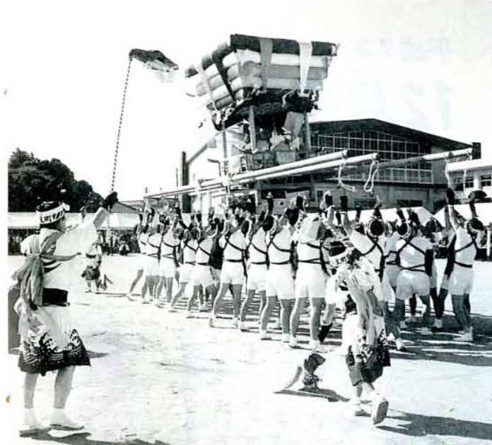
水主町ココデシヨ もってこ〜い/もってこ〜い/ 勇壮な演技に会場から盛んな声援がかかります。