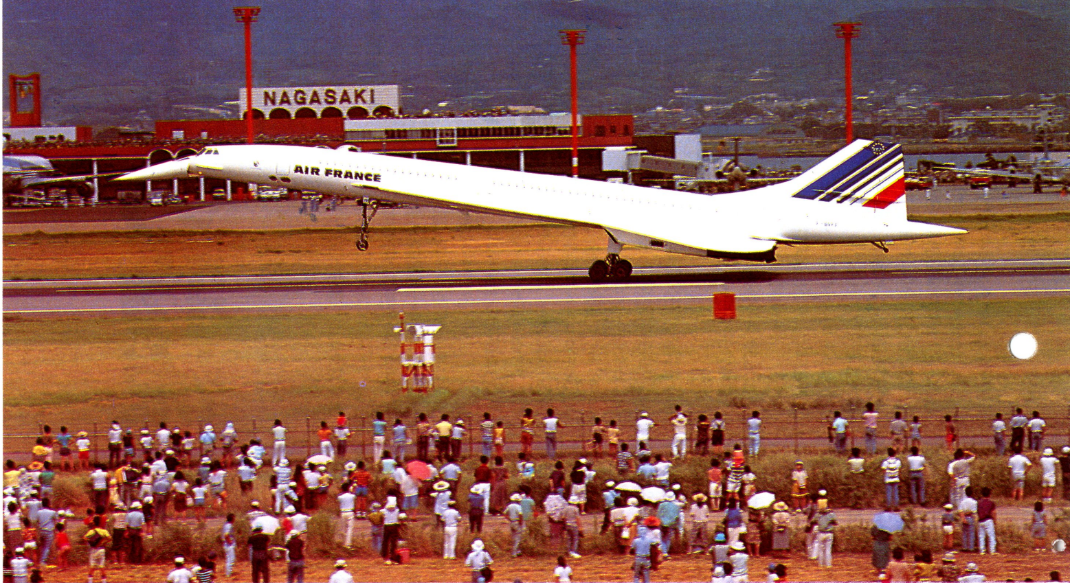
コンコルド (94・長崎空港)