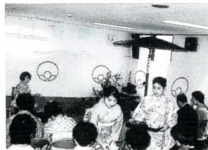
市 民 茶 会

11月1日を皮切りに始まった文化祭も、25日の舞台芸術祭を最後に幕が閉じられました。 (100%・市コミセンほか) 市コミセン会場では、美術展覧会や盆裁展、市民茶会、寒蘭展、文芸大会が、市民会館では、邦楽、吟道、民謡、謡曲日舞、華道吟、歌謡などの舞台芸術祭が行われ、期間中、多くの人の参加にぎわいました。 また、同23日は、助作座が出演した長崎県民演劇祭も行われ、芸術の秋にふさわしい文化祭となりました。