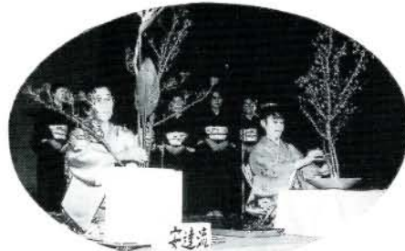
華道連合会 吟道連合会による華道吟