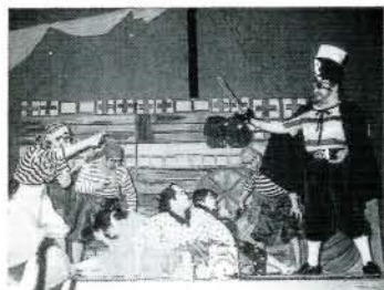
助作座が出演した長崎県民演劇祭