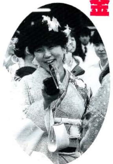
昨年の成人式より

皆さんはご存知ですか？ 20歳から60歳になるまでは、 必ず「国民年金」に加入しな ければならないことを 「国民年金」は、病気や事 故、そして老後に備えて、み んなで加入し、みんなが年金 を受給するための助け合いの 制度です。 まだ早すぎる!?、とんでも