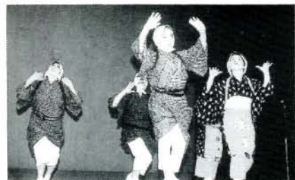
桜龍吟舞道大村吟詠会による吟道