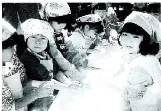
もちつき大会を楽しむ 片町保育園の園児

※上記日程表で申請できない人は、1月7日〜31日までの期間で都合のよい日に申請してください。