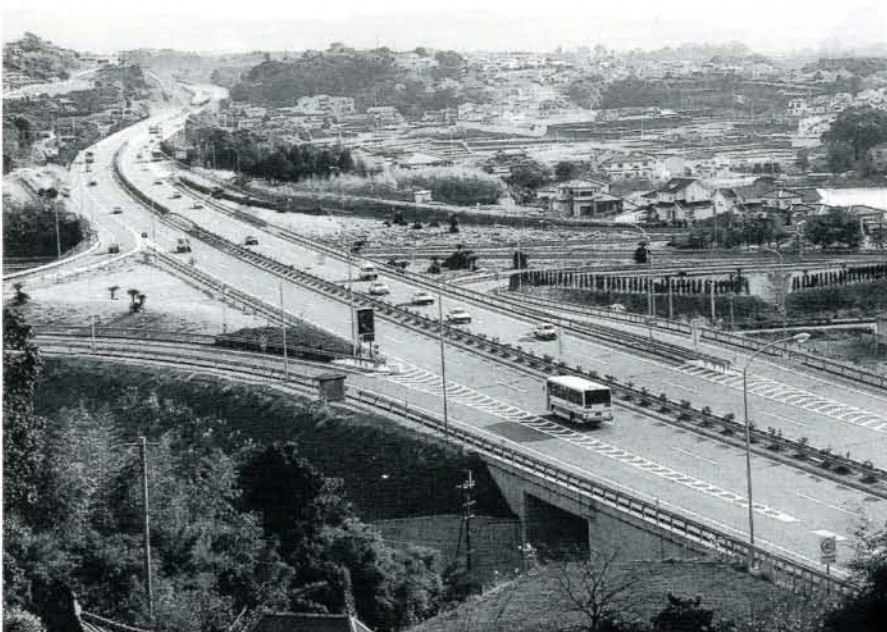
全線開通後1年を経過した九州横断自動車道・長崎自動車道、利用者も増え県央の物流拠点都市としての機能を十二分に果たします。(大村インター付近)

どうか本年も市政に対するより一層のご理解とご協力を心からお願ひ申し上げますとともに、皆様方のご健康、ご多幸を祈念いたしまして新年のごあいさつといたします。