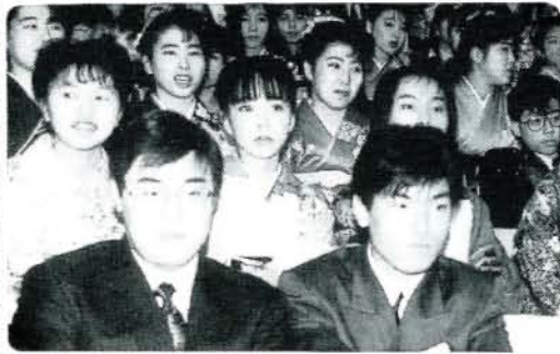
昨年の成人式より