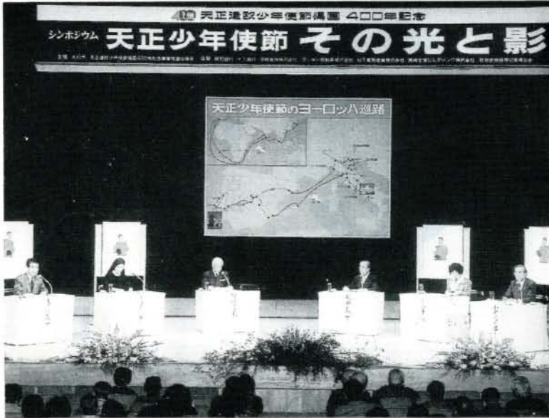
それぞれの研究発表を通して、熱心な論議が交わされたシンポジウム (左・市民会館)

天正遣欧少年使節帰国400年記念事業推進協議会では、日欧交流の先駆者となった天正遣欧少年使節たちの真相や、歴史的意義を探るシンポジウム「天正少年使節―その光と影」が12月2日、市民会館に市内・外から約500人の聴衆を集めて開かれました。