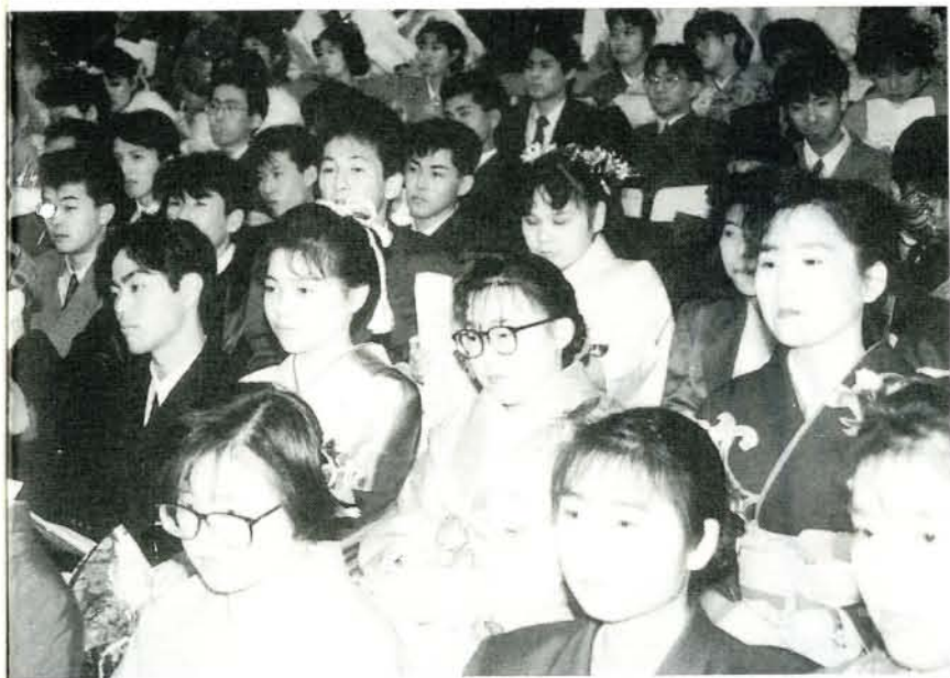
新しい門出を祝って行われた成人式。希望に満ちた若い情熱が会場に充満しています。（※・市民会館）