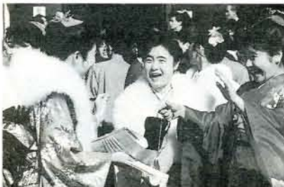
ひさしぶりの再会に胸も踊ります。

これまで学生として、両親、また、ほかの方々にお世話になってまいりましたが、これからは社会の一員として責任を持って行動し、少しでも周囲の方々の力になれるよう努力していきたいと思えます。