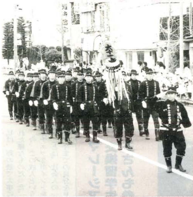
消防団や消防署、自衛消防隊そして、消防車など 総勢710人、32台が参加した分列行進 (1/8・西三城町通り)