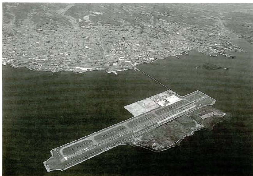
21世紀に向かって大きく羽ばたく大村市

きな被害が発生しております。近年は異常気象が常態となっているものの、長期的な観点にたつて、上水道・農業用水の安定的な確保対策が必要であります。このため萱瀬ダムのかさ上げ工事を進める一方、ミニダムの新設にも力を入れ水資源の開発に努めてまいります。