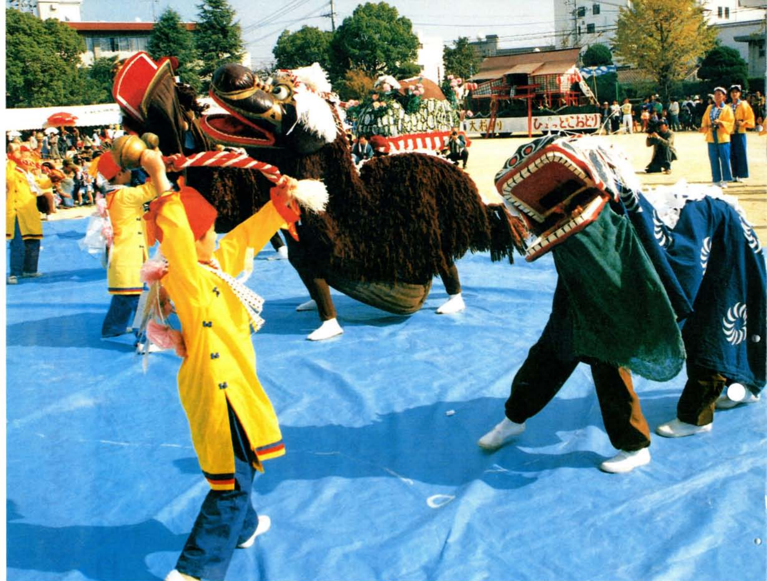
獅子舞 (H6.11.3 おおむら祭り)