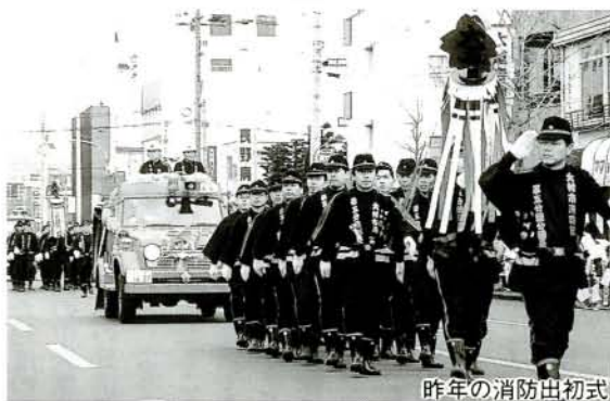
昨年の消防出初式