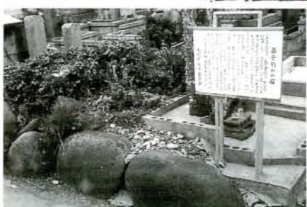
別名「涙石」とも呼ばれ、今でも苔が生えないと言われています。(杭出津3丁目)