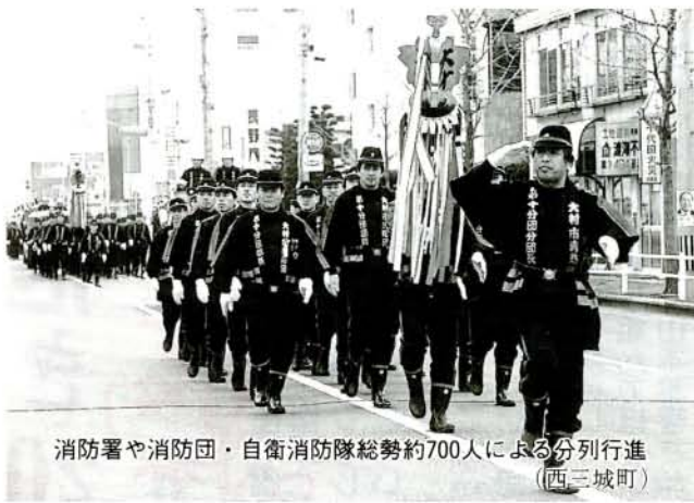
消防署や消防団・自衛消防隊総勢約700人による分列行進 (西三城町)