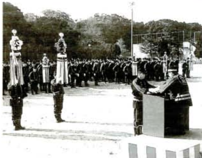
永年勤続団員の表彰などが行われた式典 (市営補助グラウンド)

新春恒例の消防出初式が1月8日、市営補助グラウンドでの式典を皮切りに、分列行進、放水演習などが行われました。