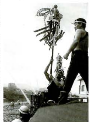
消防団(15個分団)による一斉放水演習(大上戸川)