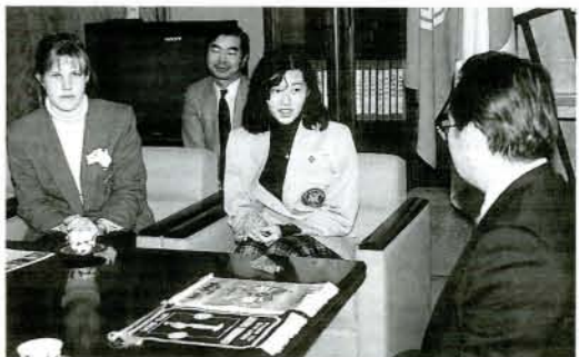
市役所を訪れ甲斐田市長と親しく歓談する2人の留学生(12/13・市役所)