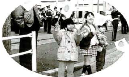
沿道のチビッコたちも盛んに声援します (西三城町)