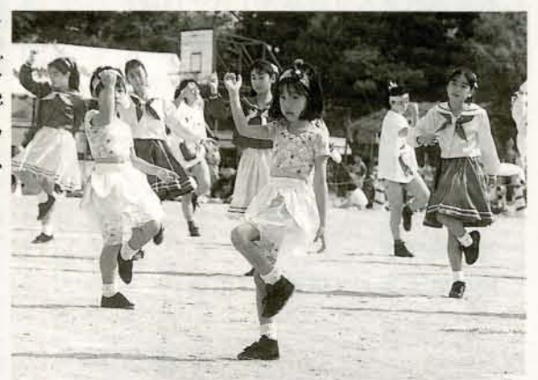
▶リズムダンス 軽快なリズムに乗って踊るミツコリズムダンスの皆さん。