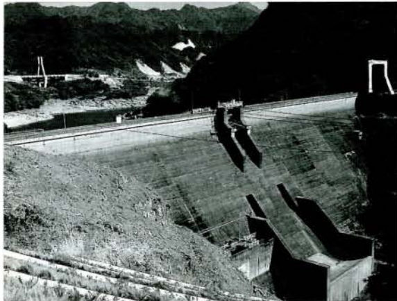
現在の萱瀨ダムえん提。右側の白線部分がかさ上げの規模を示します。(11/4・黒木町)