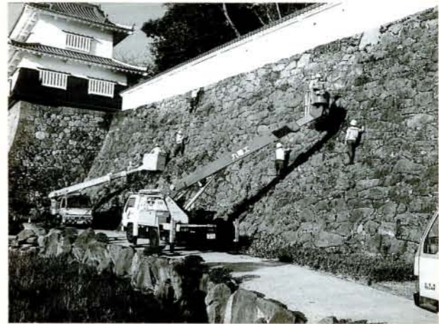
▲玖島城の石垣もスッキリ! (10/26・大村公園)

▲趣向を凝らした市民音楽祭 (10/23・市民会館) 市音楽団体協議会主催の「市民音楽祭」が10月23日、市民会館で開かれました。 恒例の市民音楽祭も35回目。今回はファミリー部門が設けられ、2家族が出演しました。 また、コーラスでは「コールあじさい」が初出演。今年の県新人演奏会出演者によるピアノ独奏や西中吹奏楽部のステージドリルの演奏も披露されました。 訪れた観客らも、バラエティあふれる音楽祭を熱心に鑑賞しました。