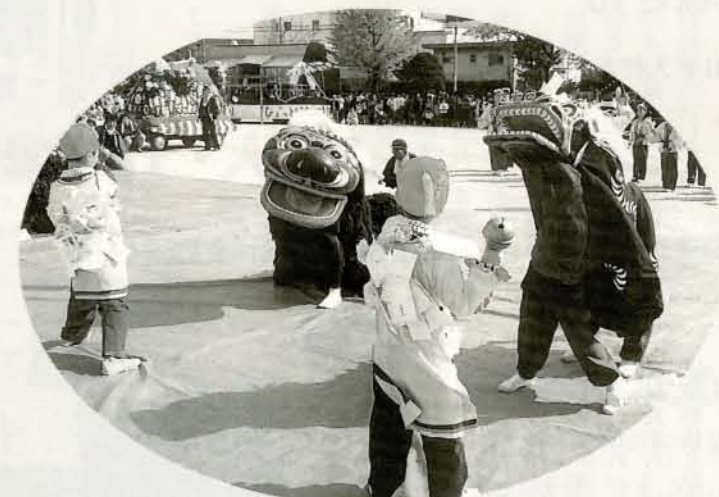
▲獅子舞 大村獅子舞保存会の皆さんによる親獅子、子獅子が披露されました。