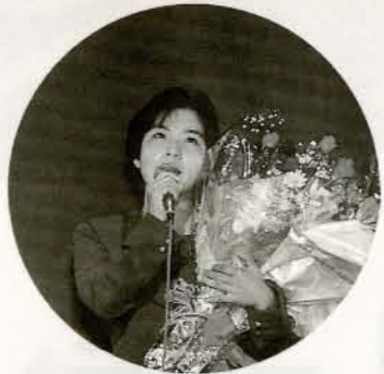
▲職場対抗歌合戦 同僚や家族などの声援に応え熱唱！優勝は、陸上自衛隊大村部隊の皆さんでした。