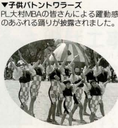
▼子供パントワラズ PL大村MBAの皆さんによる躍動感にあふれる踊りが披露されました。