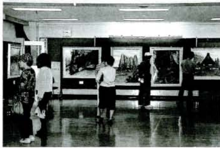
269点もの力作が展示された市美術展(11/6・市コミセン)

美術の秋を迎え、第34回市展(11月1日～6日)には、269点の力作が出品され、市民多数の参観を得て盛会のうちを終了しました。審査の結果、入賞者は次のとおりです。(敬称略)