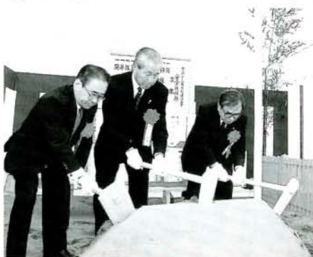
工事期間中の安全を願って、くわ入れを行う甲斐田市長(左)ら(11/4・黒木町)

ダムの大きな役割の1つに洪水調節があります。これは下流へ一度に大量の水が流れ込まないようにするためにダムで調節するものです。しかし、台風などの集中豪雨が発生した場合、現在の萱瀨ダムの容量では、洪水を調節する事はできません。