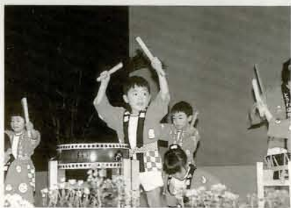
▲ときわ仲良し太鼓 前夜祭を盛り上げたときわ保育園のかわいい子ども太鼓