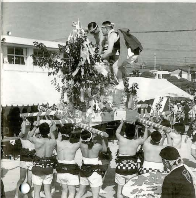
▲樽みこし 子供から大人まで10団体総勢約500人が参加。勇壮なみこしが披露されました。

第33回目を迎えた「おおむら祭り」11月2日の前夜祭、3日の本祭り、2日間たいへんなにぎわいをみせました。前夜祭は、市民会館で94ミス大村の選彰式や職場対抗歌合戦が繰り広げられました。 3日の本祭りには、23団体約1,600人が参加。大村部隊音楽隊を先頭に、リズムダンス、子供パントワラズ、民踊・日舞道行、ミス大村、歴史上の偉人を演じた時代行列、伝統芸能では、沖田踊、獅子舞、このほか勇壮な樽みこしが次々に鶴亀橋を出発、沿道のさかんな声援を受けながら祭り会場（三城小グラウンド）まで練り歩きました。 会場は祭一色、向陽高校のプラスバンド、カーニバルも披露され、多彩な催しに訪れたチビツ子からお年寄りまで、満足げに見入っていました。