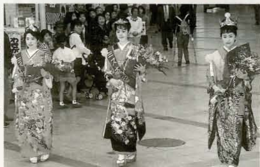
▶ミス大村パレード あてやかな振り袖で姿が良くお似合いの94ミスの皆さん