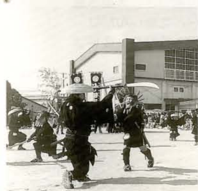
▼大村直澄公入郡1,000年記念時代行列 大村純忠など歴史上の偉人たちが勢ぞろい皆さんなかなかお似合いです