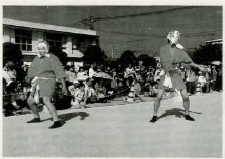
▲ひよっこ踊りも披露 独特な踊りに観客は大爆笑