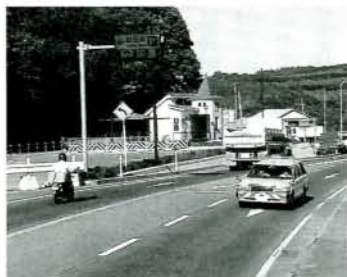
休憩施設が設置された鈴田峠パーキング

本パーキングは、建設省における長崎管内の直轄道路の中で初の無料休憩施設で、佐賀ー長崎間の長トリップの休憩施設として設置されました。(位置的にも長崎管内の中間にあたる大村市中里町に設置)。