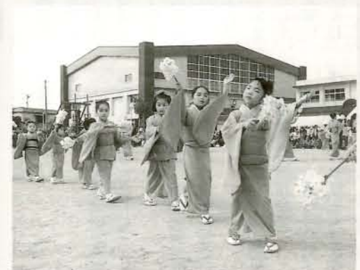
▲日舞道行 藤岡流紅の会の皆さんによる優雅な舞。