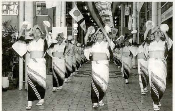
▼民踊道行 祭りに欠かせない民踊。連合婦人会、民踊協会、民踊愛好会、農協婦人部の総勢350人が参加しました。