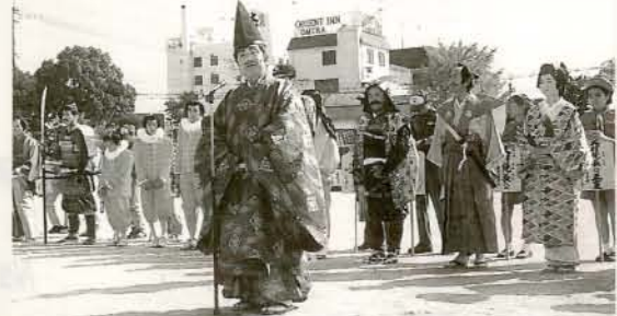
▲沖田踊 県指定無形民俗文化財の「沖田踊」別名「なぎなた踊り」といわれています。