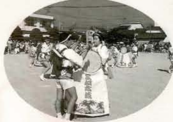
▲三城子ども太鼓 三城地域の子どもたちが出演。息もピッタリです。