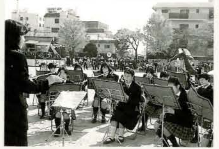
▲向陽高校プラスバンド お祭り会場は向陽高校のプラスバンドの演奏からスタートしました。