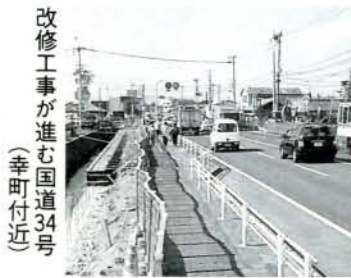
改修工事が進む国道34号（幸町付近）

慢性的な交通渋滞に陥っている国道34号の幸町付近は、現在、改修工事が行われています（5月末までの予定）。工事期間中は、大変ご迷惑をおかけしますが、市民の皆さんのご理解とご協力をよろしくお願いします。