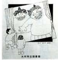
むかし話が いっぱい

また、図書館の児童室にリストの絵本を集めて、「むかし話えほんコーナー」を作っていますので、どうぞご利用ください。