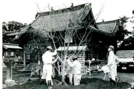
客土をした後、植え替えられるオオムラザクラ（3/16・大村神社）

るオオムラザクラ2本、そのうち1本が根元から倒れたもので、文化庁の調査官や専門家、県文化課との協議の結果残り1本も含めて、水はけのよい客土に代え、その上に高さ30cmの盛り土をし、植え替えられました。 今後も大村の市花として大切にし、かわいがっていきたいものです。