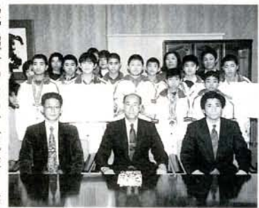
受賞報告のため、市役所を訪れた「大村剣道協会チーム」と「微神堂チーム」(3/29・市役所)