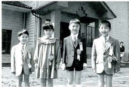
新校舎の前で笑顔いっぱいの新1年生

新入生歓迎会では、趣向を凝らした劇や踊り、ゲームもあり、新1年生も一緒になって楽しんでいました。