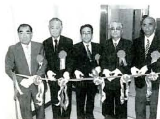
エレベーターのテープカットを行う甲斐田市長ら（4/12）

助成額 年にガソリン券10枚を支給します。 ※利用者は、これまでの福祉タクシー助成制度との重複申請はできません。申し込み・問い合わせ 福祉課福祉係