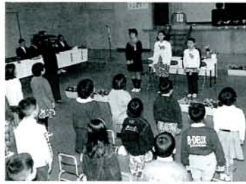
在校生との別れを惜しむ卒業生