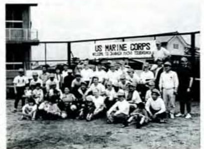
ソフトボールなどで交流を深めた、つばさ会とアメリカ海兵隊の皆さん。 (5/3・竹松小グラウンド)