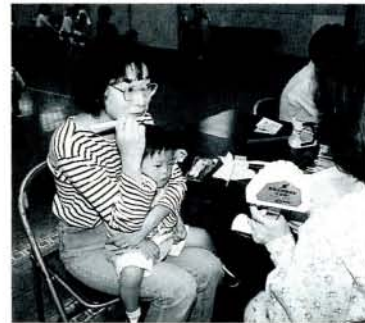
歯のブラッシング指導 (5/12・市コミセン)

福重地区の食生活改善推進員の委嘱状交付式が、4月19日に福重出張所で行われました。 現在、食生活改善推進員は松原地区に29人、鈴田地区に30人が活躍。今回、福重地区では福重を中心に、松原、竹松、西大村、大村の婦人の方40人が1年間熱心に教育を受け、委嘱されました。推進員は、食生活に関する知識の普及・相談業務・講習会などの活動を行い、赤ちゃんからお年寄りまで健康で明るい家庭づくりができるようお手伝いをします。