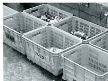
減量化は分別の徹底が決め手