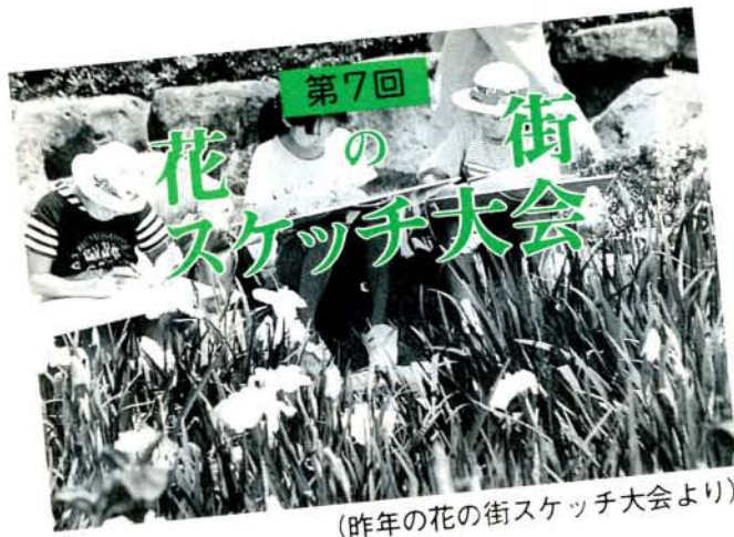
(昨年の花の街スケッチ大会より)