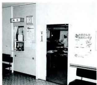
内科外来受付窓口