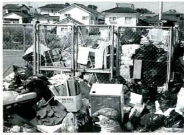
ごみの中に危険なものが混じっているかも...

③ガソリンやシンナーなど可燃性が入った缶・ビン類は、空を確かめてふたをしないで出してください。