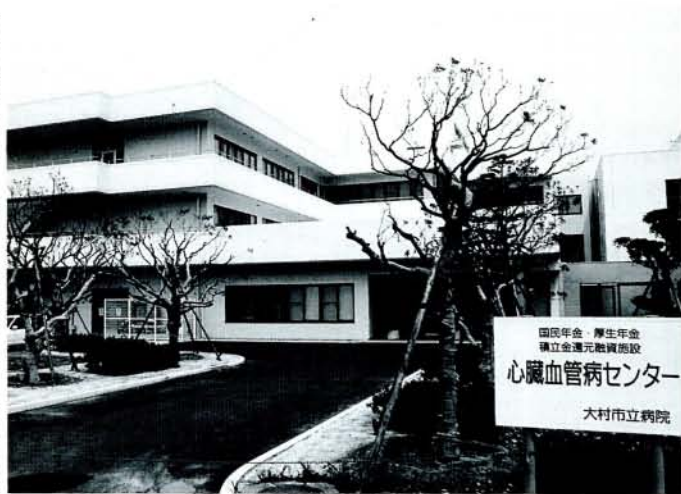
国民年金・厚生年金 積立金連元融資施設 心臓血管病センター 大村市立病院