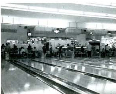
ゲームを楽しむ子どもたち（4/16・パールレーン大村）

「大村子供の家」「光と緑の園」の小学3年生から高校生まで100人を招待。プレーに熱中し、お互いが意気投合。ストライクが続出する場面もあり、子どもたちは、大変喜んでいました。