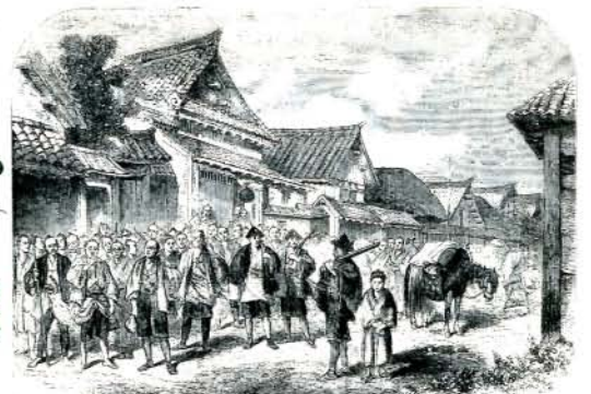
ロンドンニュース(1861年)に掲載された大村の様子