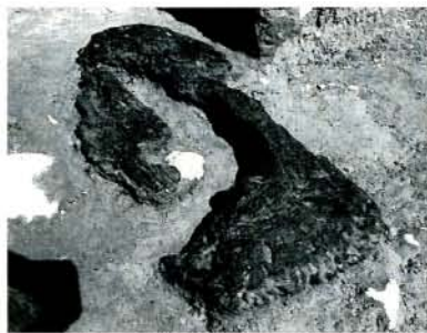
発掘された「舟状木製品」 （黒丸遺跡・沖田町）

市教育委員会は、黒丸遺跡（沖田町）の発掘調査を行いました。このほど全国的に見て初めてと思われる縄文時代の「舟状木製品」が、郡川河口に近い水田の下から出土しました。