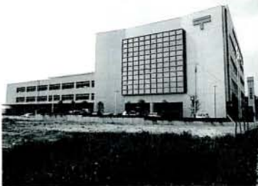
九州第2の規模を誇る大村郵便局(森園町)