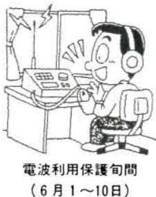
電波利用保護旬間 (6月1～10日)

現在、警察や消防などの重要無線やテレビ・ラジオなどに多くの混信・妨害が発生しています。これらの多くは不法無線局から発射される電波によるものです。 多くの人が電波を公平に、しかも能率的に使用できるようにルール(電波法)を守り、きれいな電波環境を作りましょう。