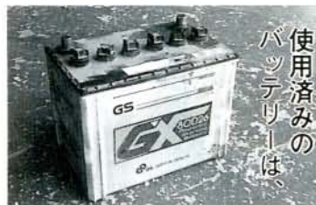
使用済みのバッテリーは、