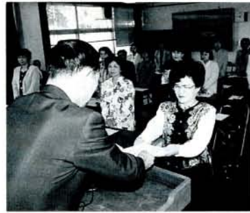
食生活改善推進員の委嘱状交付式 (4/19・福重出張所)

「私たちの健康は私たちの手で」をスローガンに、正しい食生活の普及と地域の健康づくりを推進していく