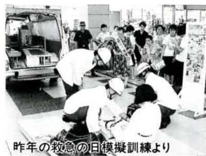
昨年の救急の日模擬訓練より

昭和38年に救急活動が消防の業務と位置づけられて以来、救急出動件数は、年々増加しており、平成3年中の県下の出動件数は2万8,609件、これは18分に1回の割合で出動したことになります。