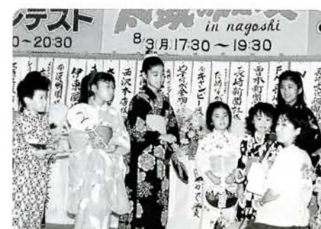
チビッコ、ファミリー、大人の部が行われたゆかた納涼コンテスト。ゆかた姿がかわいいですね。