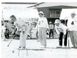
昨年の交通安全ゲートボール大会より

申込期限 9月25日(金) 申込先 教育委員会体育課 ※申込用紙は、体育課および各出張所にあります。