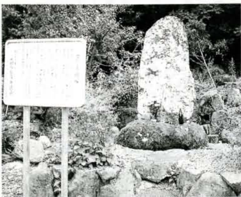
花や線香が絶えない霊魂塚 (田下町)

元文3年(1738)、現在の宮代や田下に天然痘が大流行しました。その頃は疱瘡と呼ばれて、治療の方法もなく伝染しやすかったため、たいへん恐れられていました。