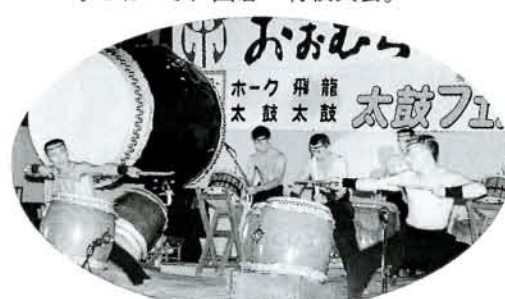
湯布院の源流太鼓も友情出演