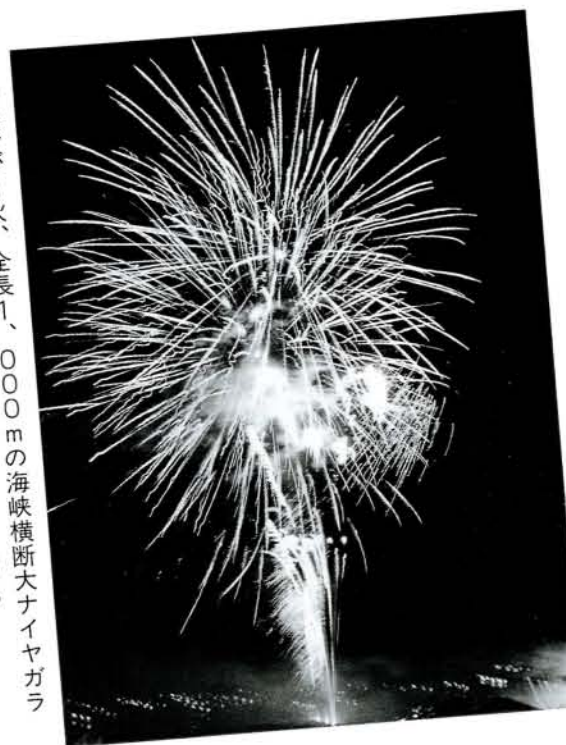
臼島大かがり火、全長1,000mの海峡横断大ナイヤガラなど6,000発の花火大会で、まつりの幕明け。

第13回おおむら夏越まつりは8月1日から3日まで行われ、おおむらの夜はまつり一色、3日間約20万人(主催者発表)の人出でにぎわいました。 8月1日の宵まつりでは、臼島大かがり火や夜空に花を咲かせた6000発の花火に大きな歓声が上がっていました。 2日・3日は本まつり、市道大村駅前線をメイン会場に、市民の無事を祈った市内25神社合同による夏越大祭やチビッコ相撲大会、ゆかた納涼コンテスト、太