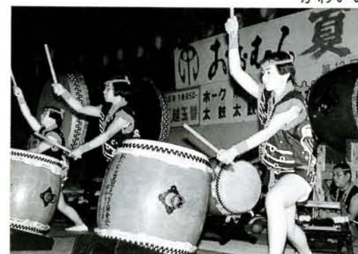
もうおなじみのくじら太鼓やホーク太鼓などが出演した太鼓フェスティバル。祭りに太鼓は欠かせません。