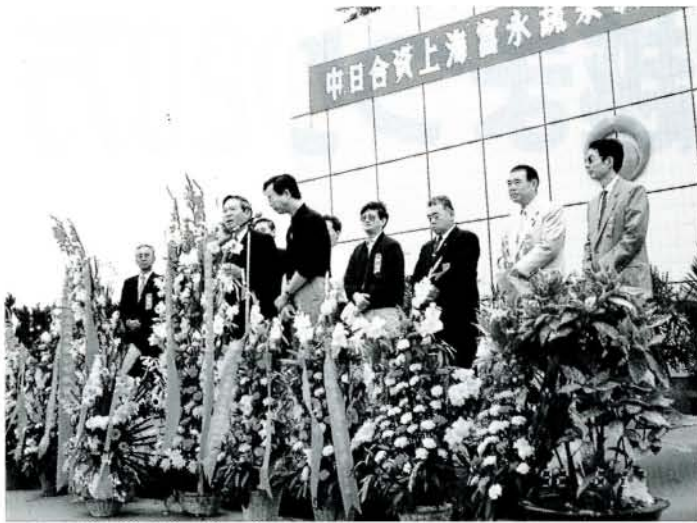
合作合資会社の開業を祝った式典(6/26・上海にて)

上海市の国営農場・前衛実業総会社と富の原の農産加工メーカー大成物産との合作合資会社の開業式典がこのほど上海市で行われ、日中間の本格的な経済交流が始まりました。昭和59年8月、中国・上海市と大村市が友好都市となつて以来、小学生のサッカー親善試合、西中プラスチックの派遣、吉原工業への産業技術