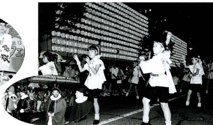
趣向を凝らした踊りが披露されたおおむら音頭コンテスト。27チーム約1,500人が出場。今回は、ポルトガルの民間友好使節団も特別出演しました。