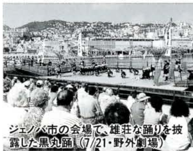
ジェノバ市の会場で、雄壮な踊りを披露した黒丸踊(7/21・野外劇場)

5月15日から8月15日までイタリア・ジェノヴァ市で開催された「国際船と海の博覧会」に、500年以上の伝統をもつ「黒丸踊」が出演、郷土芸能をアピールしました。博覧会には、米国、フラン