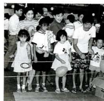
子供たちに人気のたのしか広場

鼓フェスティバル、つな引き大会、夏越玉替、ミュージックフェスタ、各チーム趣向を凝らしたおおむら音頭コンテストなど、多彩な催しでまつり会場は最高潮。また、今回は郷土芸能である黒丸踊り、水主町コッコデショも出演、まつりを一層盛り上げました。 共に創り、共に楽しめるまつりを目指した「おおむら夏越まつり」。市民総参加のまつりとしてすつかり定着しているようです。