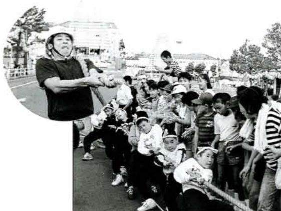
力と力の競いあい。応援にも力がいったつな引き大会。