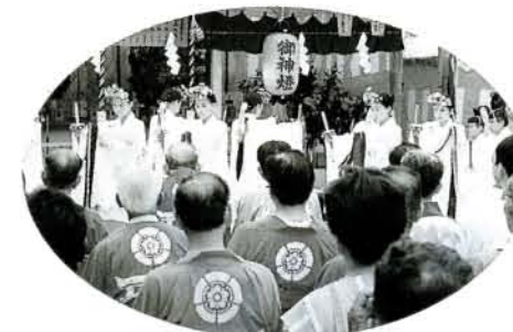
市内25神社合同による夏越大祭