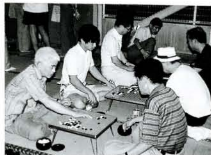
手ごわいぞ！囲碁・将棋大会。