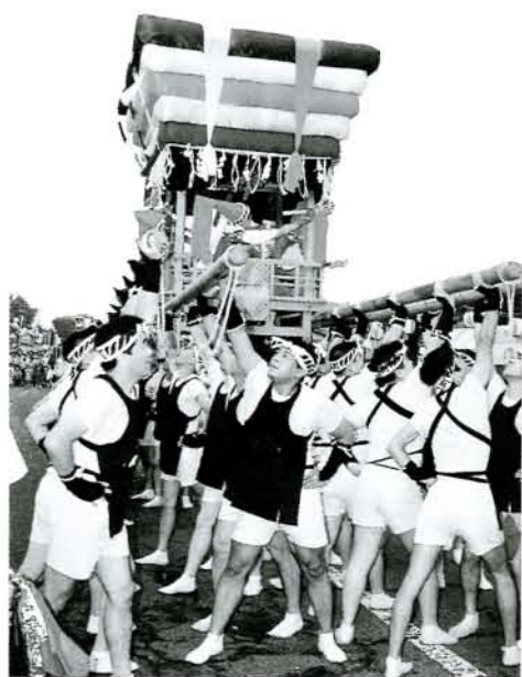
水主町コッコデショ