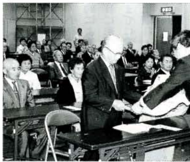
昨年の金婚祝賀記念品贈呈式より

に提出してください。 申込締め切り 9月18日(金) 問い合わせ 福祉課老人福祉係