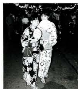
ゆかたがお似合いですね。