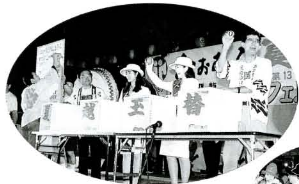
かえましよう、かえましよう！夏越玉替