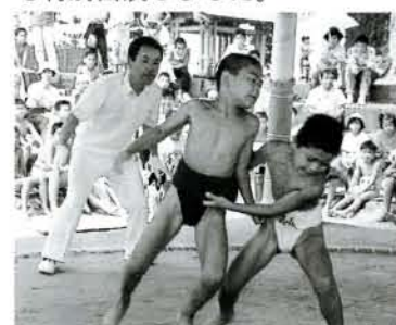
大村、諫早の17チームが参加しての「ちびっ子相撲大会」力強い取り口に声援が飛び交います。(松原・八幡神社)