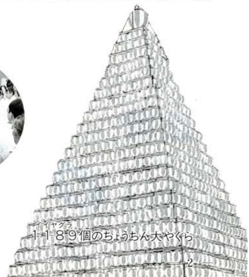
1・1・8・9個のちようちん大やぐら