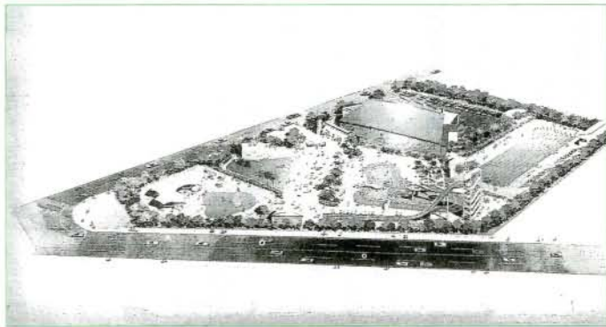
新市民プールの完成予想図

新市民プールは、旧プールから約500メートル離れた森園公園内の約1万8千平方メートルに建設されます。総事業費は約13億円。完成は、今年の9月末（50メートルプールは平成8年3月末）の予定です。 起工式には、甲斐田市長をはじめ関係者ら約40人が出席