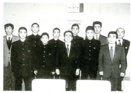
九州大会出場のため、市役所を訪れた「郡中学校男子バレーボール部チーム」(2/17市役所)