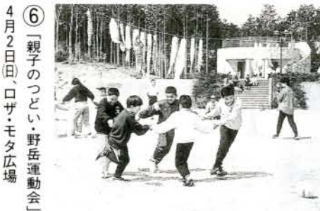
⑥ 「親子のつどい・野岳運動会」 4月2日(日)、ロザ・モタ広場