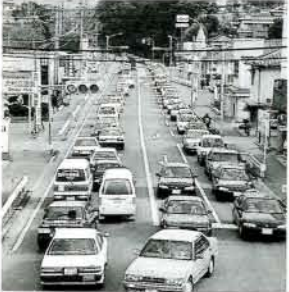
大型店などの進出が著しい

高良谷牧場について本年度から本場およびアクセスを整備し、市民にも親しまれるいわゆる「ふれあい牧場」にします。