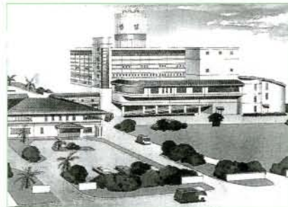
環境対策を重視したごみ処理施設の完成予想図

施設の老朽化や、年々増加するごみ処理に対応するため、新しく建設される清掃センターごみ処理施設の起工式が2月22日、森園町の建設予定地で行われました。