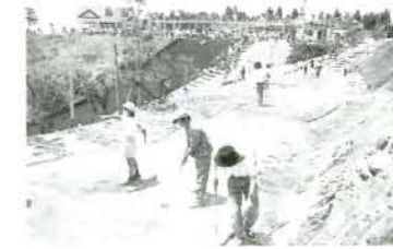
⑩ 琴平スカイパーク