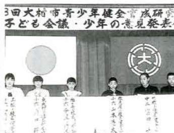
熱い思いや主張を述べる子どもたち (2/26・市コミセン)

で開かれました。 今回は幸町・徳泉川内・今村・向陽寮の4つの子ども会が発表。「小規模子ども会の直面している問題点について」「廃品回収活動の現状と問題点」「壁面コンタクトへの取り組みについて」など、それぞれの体験や現在取り組んでいる活動内容を紹介。 最後は向陽寮の子ども会が「のんのこ節、ドラえもん」を舞台で披露し、会場に出席した父母や育成者から盛んな拍手が送られました。