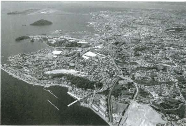
自然と調和した快適な環境づくりをめざす大村市

なお、平成7年度の予算概要については、6月号の「財政事情説明」でお知らせします。