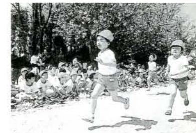
① 三鈴運動会 4月16日(日)、惣原運動場