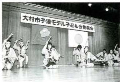
練習成果を披露する向陽寮のみなさん (3/5・市コミセン)

焼却炉は、3基合計で16時間あたり1111トンのごみ処理ができ、現行の2倍以上の処理能力があります。また、焼却時の余熱は、施設内外の冷暖房などに有効利用されます。総事業費は約46億円。平成9年4月に稼働予定です。 起工式には、甲斐田市長をはじめ関係者ら約50人が出席しました。 施設の特徴 ● 粗大ごみ、資源ごみ処理によるリサイクルを行います ● 焼却時の予熱を有効利用 ● 高度な燃焼システムを導入した最新設備