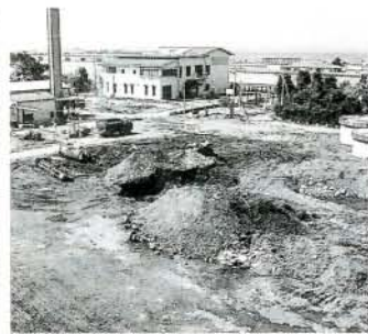
建設予定地(森園町)

施設の老朽化や、年々増加するごみ処理に対応するため、新しく建設される清掃センターごみ処理施設の起工式が2月22日、森園町の建設予定地で行われました。