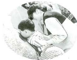
昨年のほら吹き大会から

参加は市内外を問わず、どなたでも結構です！ 大村神社（大村公園内）にある大きな石を吹いて、音の大きさを競います。そもそも、その音色がほら貝を吹いたと