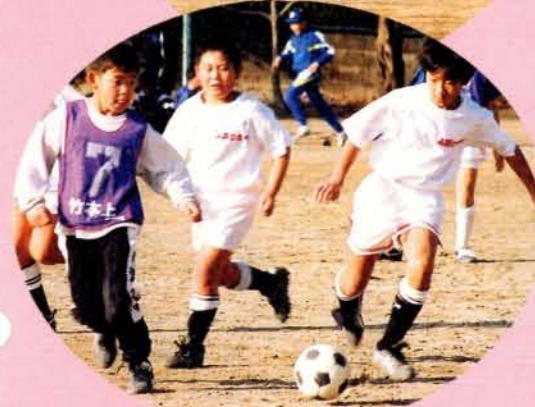
▲1月15日竹松小学校で竹松小校区子ども会育成連絡協議会サッカー大会が開かれ子どもたちは元気よくプレーしました。