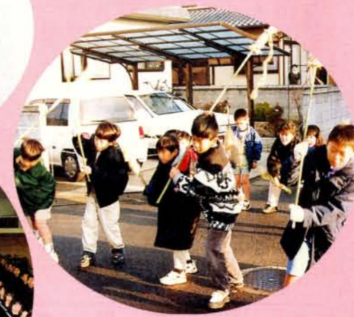
▲1月15日水田町において恒例のもぐらうちがあり無病息災を願いました。