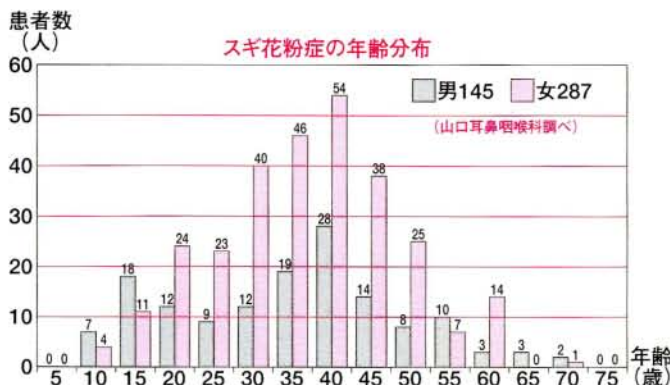
スギ花粉症の年齢分布

一度発症すると毎年おこる花粉症ですが、予防が第一と考え治療をおこなってください。