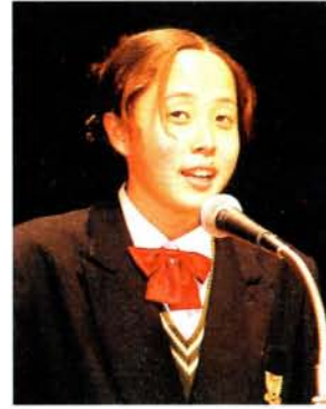
向陽高等学校 三年