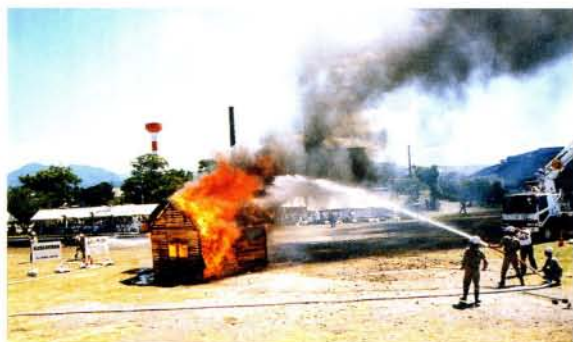
昨年の防災訓練から

火災が発生しやすい時期です。1人ひとりが火の取り扱いには十分注意しましょう。また、日ごろから火災を出さないようにするためにはどうすればよいか、家族みんなで話し合う機会をもちましょう。