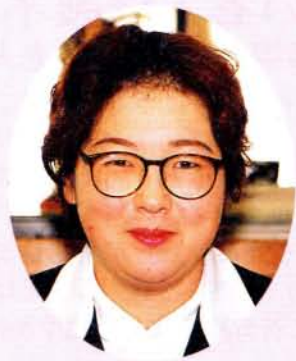
泉の里ホームヘルパー