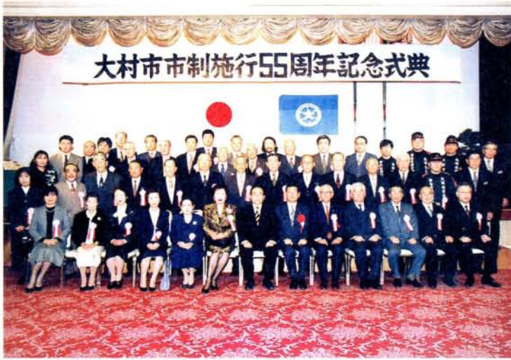
市政功勞者として表彰を受けられた皆さん (2/10・パークベルズ)