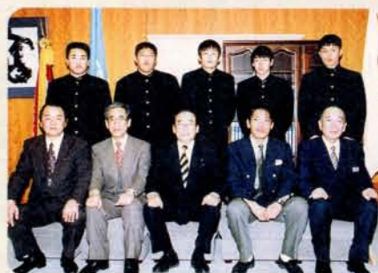
レスリングチーム