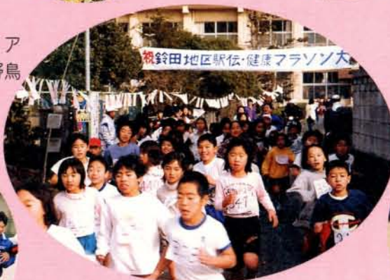
▲1月19日、鈴田地区においてマラソン大会が開催され、子どもからお年寄りまで走りぬきました。