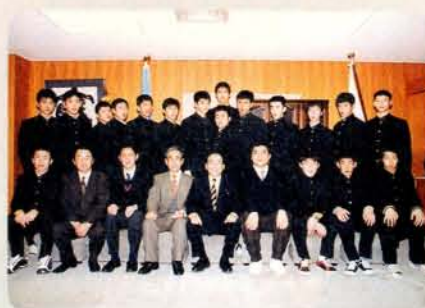
バレーボールチーム

第28回全国高校バレーボール大会・第40回全国高校レスリング大会に出場を決めた、工業高校（川久保校長）の選手たちが2月10日、市役所を訪れ、甲斐田市長にあいさつをしました。 頑張ってください。