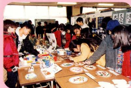
▲1月29日から31日まで障害児学級の作品展が中地区公民館で開かれました。