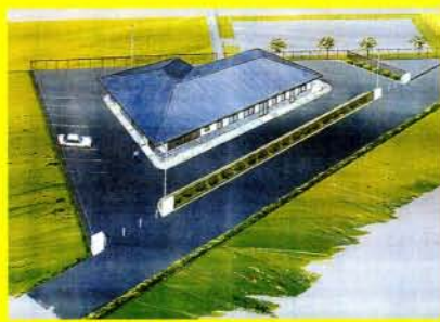
汚水処理施設完成予想図