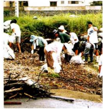
昨年の沿岸清掃(大村公園先沿岸)