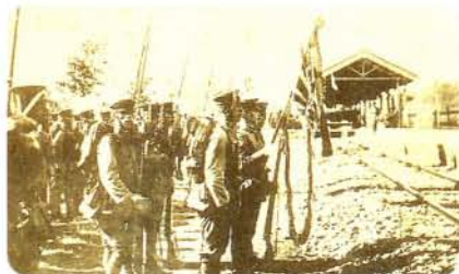
大村駅から出征する兵士 (昭和初期)