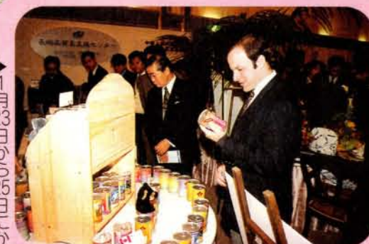
▶1月23日から25日にかけて海外商品見本市が開催され大勢の市民でにぎわいました。