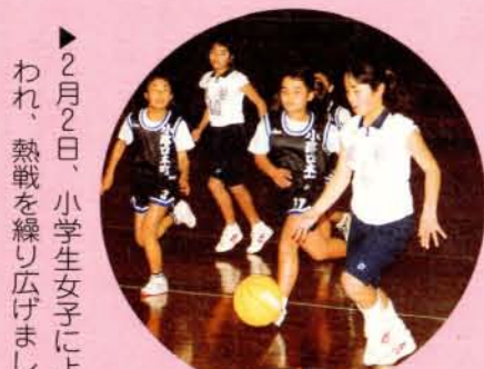
▼2月2日、小学生女子によるポトボール大会が行われ、熱戦を繰り広げました。