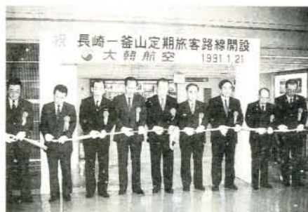
長崎―釜山線の就航を祝ったテープカット (左・長崎空港)

大韓航空の長崎―釜山線が1月21日から開設され、同日、長崎空港で就航記念式が行われました。これまでは、昭和63年12月長崎―ソウル線が開設以来定期就航していましたが、釜山への旅行者が増え、釜山線の開設を望む声が強いことなどから、長崎―釜山線に切り替わったものです。