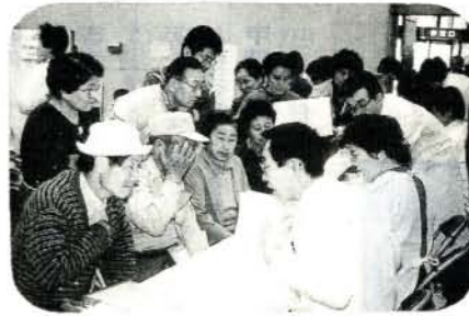
昨年の健康展より

市民一人ひとりの健康と幸せを願い、市民総参加の健康づくりをめざして開催します。 日時 3月10日(日)、午前10時～午後3時 場所 市コミセン