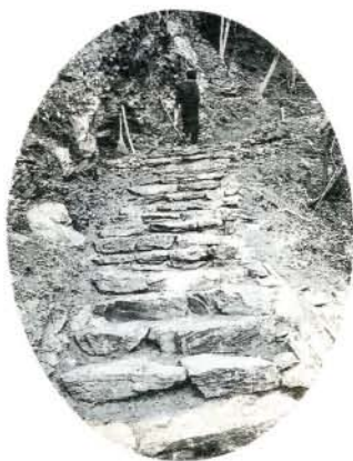
着々と進められている遊歩道整備

市テント購入、おむら太鼓連活性化事業(太鼓購入)、福祉フェア事業(伝承民芸品作り工具購入) ●萱瀬：郷土誌編集、萱瀬新春駅伝記念大会(1月13日実施)、萱瀬地区案内用掲示板 ●竹松：旧竹松黒丸郷沿革記念碑