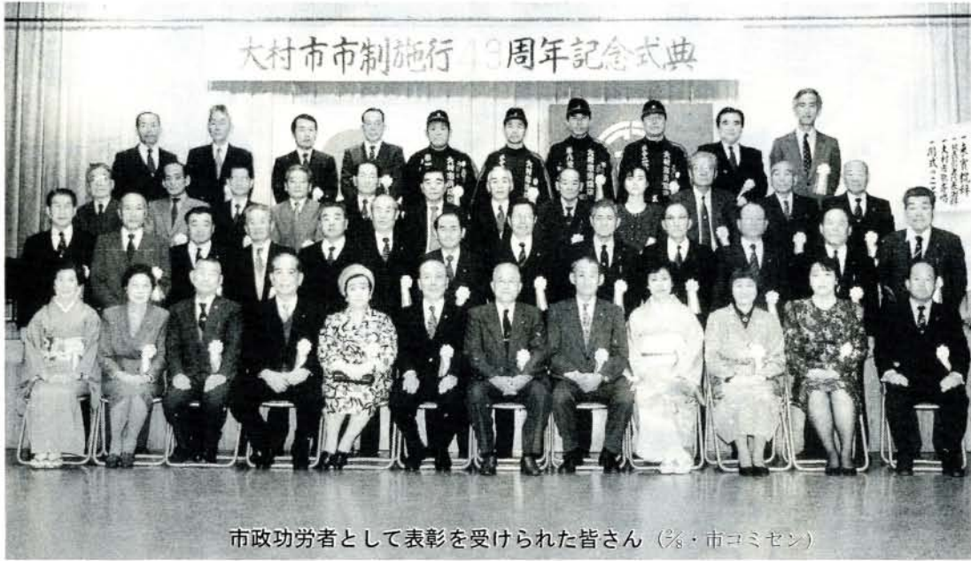
市政功勞者として表彰を受けられた皆さん（※・市コミセン）