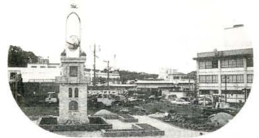
3月完成予定の駅前広場(仮称)整備事業

表(5)は、職員が学校卒業後すぐ採用された場合の経験年数別の給料月額を示したものです。