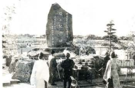
郡地区ほ場整備事業の完成に伴う記念碑の除幕式 (左・荒瀬町)

昭和57年から進められていた「郡地区県営ほ場整備事業」が完成。1月23日、現地(荒瀬町)で記念碑の除幕式が、その後、市農協会館で完了式が行われました。