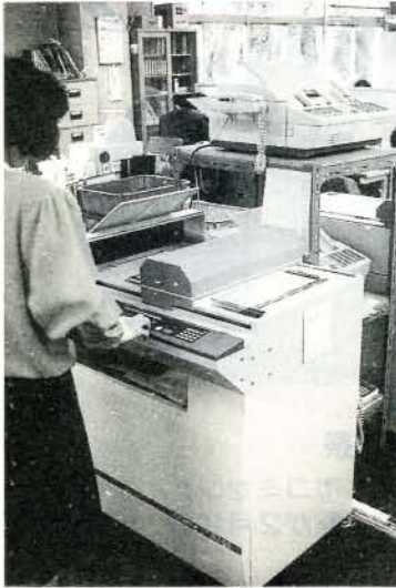
漢字オンライン、ファクシミリ導入などにより、住民サービスの向上が図られています。

昇給は、1年間良好な成績で勤務した実証に基づき1号給上位へ上がることをいいます。給与改定は、一般的に労使交渉によって決定される民間給与と異なり、公務員の場合は、給与についての専門的機関である人事院が、毎年4月1日現在で民間給与との対比をして、差があった場合に行われる人事院勧告を尊重して実施される、国家公務員の給与改定に準拠して給料の引き上げを行うわけですが、これを給与改定といっています。