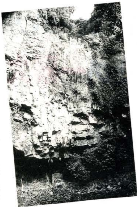
滝の高さが70メートルもある裏見の滝

ふるさと創生事業の一つとして行っている「大村21活性化地域活動事業」のトップを切って取り組んでいる、裏見の滝観光道路の整備が着々と進められています。