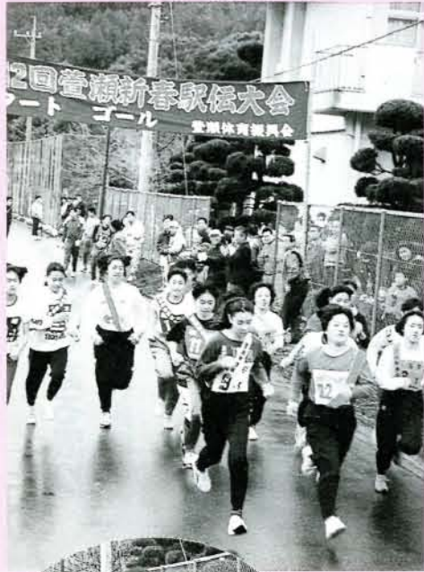
▲女性も加わり健脚競う (1/10・豊瀬中学校周辺) 1月10日、8町内16チームで競われた「新春豊瀬駅伝大会」。今回で12回目を迎えます。ますます盛んになっています。この大会は、同地区体育振興会がスポンサー。