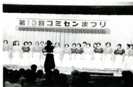
コミセンまつりより

お気軽にお出かけください。 日時 2月6日(土)、午後7時開演(6時30分開場) 場所 市コミセン(入場無料) 曲目 宇宙の島、ナウシカほか(ソロ、二重唱、三重唱あり) 連絡・問い合わせ 市コミセン(☎53161)