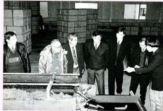
▲農業技術などを視察 (1/13・人参選果場)

毎年恒例となった、新春百人一首かるた大会が1月4日、市コミセンで開かれ、子どもたちが自慢の腕を競いました。冬休み教養講座(市コミセン主催)として開講されていた、かるた教室の締めくくりとして毎年開かれているもので、市内の小学生約40人が参加。札が読み上げられると、子どもたちの手がすばやく動きます。中には「あつ、まちがった!」の声などもあり、会場は楽しい雰囲気になっていました。