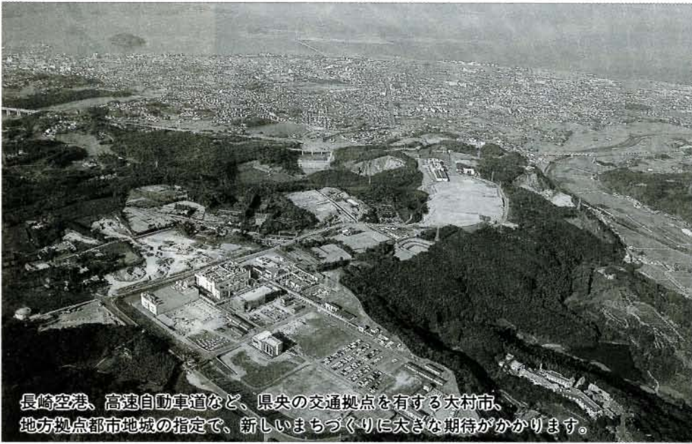
長崎空港、高速自動車道など、県央の交通拠点を有する大村市、地方拠点都市地域の指定で、新しいまちづくりに大きな期待がかかります。

地方拠点都市地域の一次指定に県央地域（大村市をはじめ2市10町）が選ばれ、21世紀をふまえた新しいまちづくりに大きな弾みがありました。