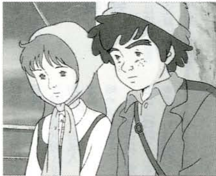
クオレ物語―難破船―