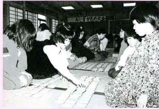
▲楽しく新春かるた大会 (1/4・市コミセン)

1つを通し地区間の親睦を図ろうと行われているもので、駅伝には中学生以上が5区間で健脚を競いました。なお、今回から女性も加わることにになり、第1走者として奮闘しました。