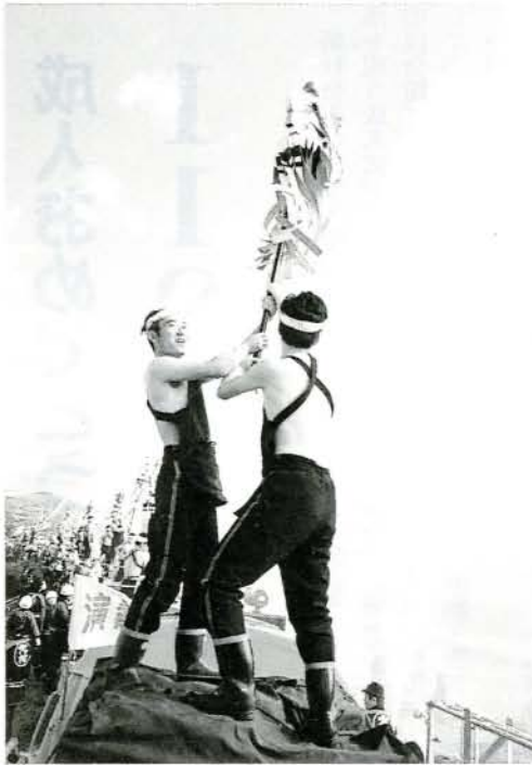
15個分団による一斉放水演習 (大上戸川)