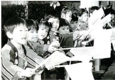
幼少年消防クラブのチビッコたちも盛んに声援します (西三城町)