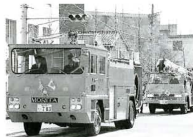
消防車32台による車両パレード (西三城町)

新春恒例の消防出初め式が1月8日、ポート場駐車場で式典を皮切りに、分列行進、放水演習などが行われました。 式典では、永年勤続団員や一般協力者、無火災分団などの表彰が行われました。 市中行進には、消防団15個分団、消防署、自衛消防隊それに消防車など総勢710人、32台がさっそうと行進。 沿道では、幼少年消防クラブの幼児や道行く人たちが盛んな声援を送りました。 最後は、大上戸川で行われた全消防分団による一斉放水演習。今年も火災が少ないことを祈りつつ、防災の決意を新たにしました。 なお、表彰を受けられたのは次の皆さんです。 (敬称略)