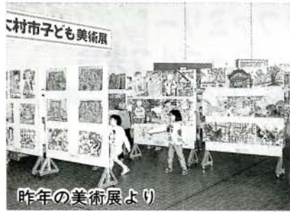
問い合わせ 市コミセン(☎3161子ども美術展係)

子どもたちの情操教育と健全育成を目指した「第5回子ども美術展」を開きます。 作品展示期間 2月26日(金)～3月4日(木) 時間 午前9時～午後7時 (最終日は午後5時) 会場 市コミセン ※入賞作品を展示します。