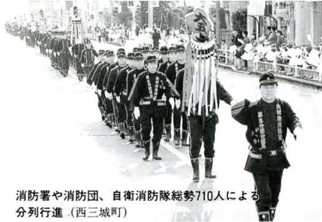
消防署や消防団、自衛消防隊総勢710人による分列行進 (西三城町)