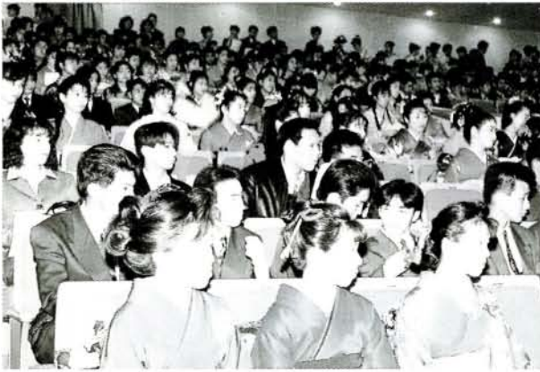
社会人としての第1歩を祝った成人式 (1/15・市民会館)