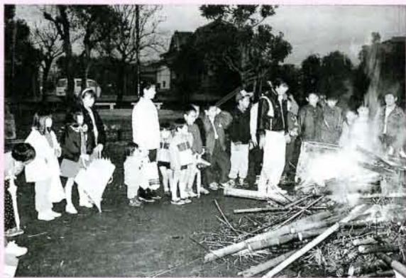
▲無病息災を祈って (1/7・大川田公園)

▲お互いの技術向上を目指し (1/10・海上自衛隊グラウンド) 大村・諫早・島原の3地区のサッカー少年が、親睦と融和を図り、共に技術の向上を目指そうという三地区親善サッカー大会が1月10日、海上自衛隊グラウンドで行われました。参加したのは、主に5〜6年生のチーム。大会前日3度目の全国制覇を果たし、がい旋してきた国見高校サッカー部の影響を受けて、子供たちも大ハッスル、足さばきもめごと相手がゴールをおびやかします。