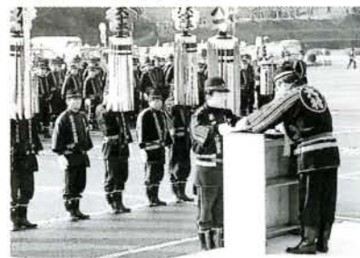
永年勤続団員の表彰などが行われた式典 (ポート場駐車場)