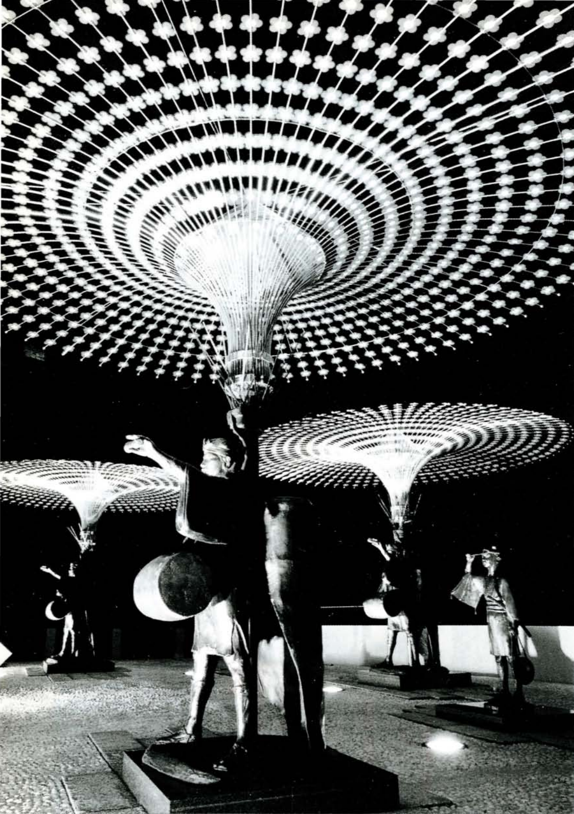
(ライトアップされた黒丸おどり像：森園公園)

直径5mもある花傘は壮観。特に、夜間はライトアップされ花輪が浮き出すさまはひとときわ鮮やかさを増し、目を見張るものがあります。 今後、空の玄関口大村を強く印象づけることでしょう。