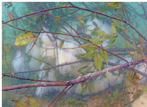
イカシバに付着したアオリイカの卵

大村湾で産まれたイカは、翌年に産卵のために同じ場所に戻ってくると言われており、イカの里海を作ることでイカ資源の維持・増殖を期待しています。2年目になる今年度は、昨年以上の産卵がみられ、早くもその効果が現れています。