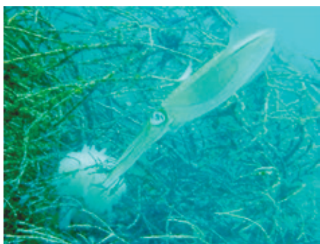
アオリイカの産卵の様子

大村市漁業協同組合組合員。16歳から漁を始め、漁師歴57年の大ベテラン。年間を通して箱メガネ・刺網・底引き網・カゴ・延縄(はえなわ)を用いた様々な漁を行う。春のウニ漁、冬場のナマコ漁は夫婦で漁にでて二人三脚で行っています。