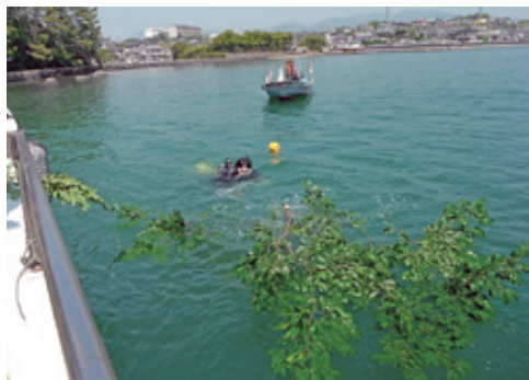
イカシバ設置の様子

イカシバとは、伐採した椎(しい)などの木に重石(おもし)をつけて海底に沈めた人工の産卵床のことです。この取り組みは、大村市沿岸域に位置する臼島、寺島、鹿ノ島周辺のイカの産卵に適した場所に、イカの産卵床となるイカシバを設置することで、イカの産卵場所を作り、イカ資源を増やすことを目的としています。