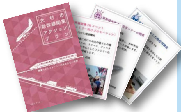
▲「新幹線開業アクションプラン」は市役所で配布しています。また、市ホームページで見ることができます。