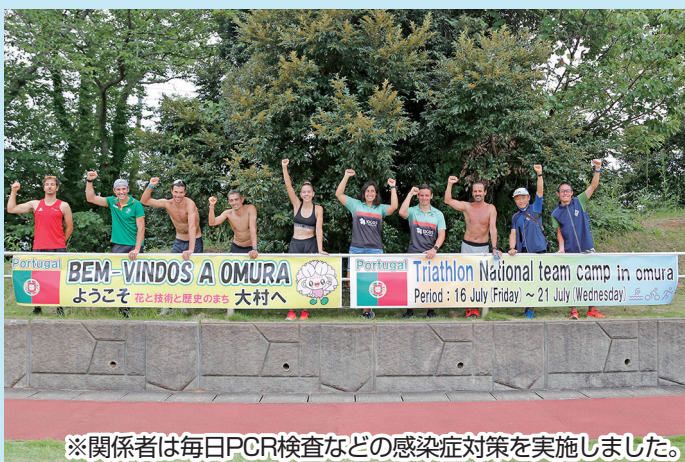
※関係者は毎日PCR検査などの感染症対策を実施しました。