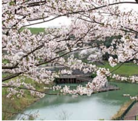
↑アルカディア記念公園