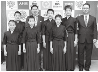
📅 3/16 第58回全国選抜少年剣道錬成大会(茨城県)に出場した市剣道協会強化選手チームの皆さん