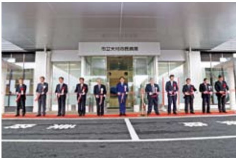
←市長や事業関係者が竣工を祝いました

地 域医療の中核病院として地域に根ざした医療体制を確保するため、新しく市立大村市民病院を建て替え、竣工式を行いました。9日には、内覧会で市民の皆さんにもお披露目。24日から新病院で診療を開始しました。今後、旧病院の解体工事などを進め、来年4月のグランドオープンを目指します。