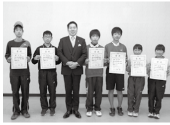
📅 3/10 第16回全国小学生ソフトテニス大会(千葉県)に出場したジュニアソフトテニスクラブの皆さん