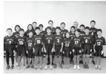
📅 3/9 春の小学生ドッジボール選手権九州大会(宮崎県)に出場したADVANCE☆西大村の皆さん