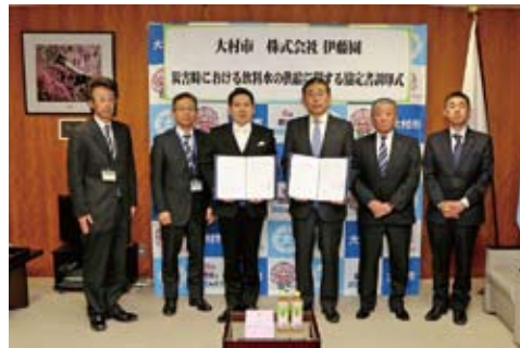
←協定書を交わし、災害時の備えを強化しました

飲 料メーカーの伊藤園と、「災害時における飲料水の供給に関する協定」を締結しました。これは、地震や風水害などの災害発生時に、市が要請すれば、容器入りの水やお茶などを優先的に供給していただくもの。同社とこの協定を締結するのは県内市町では初めてです。