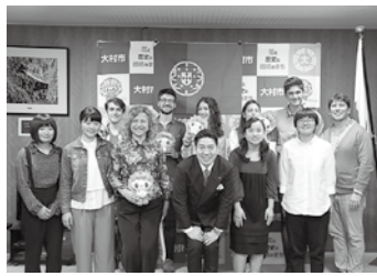
📅 4/6 姉妹都市・ポルトガル共和国シントラ市からホームステイのため来訪した学生の皆さん