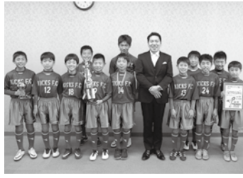
📅 3/15 第2回プレミアリーグU-11チャンピオンシップ2017(千葉県)に出場したキックスフットボールクラブU-12の皆さん