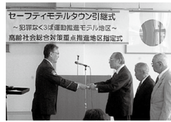
📅 4/3 セーフティモデルタウンおよび高齢社会総合対策重点推進地区に、西大村地区町内会が指定されました。