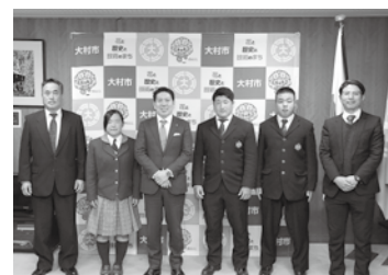
📅 3/17 埼玉県で開催されたラグビーの男女各選抜全国大会に出場した本市出身の選手の皆さん