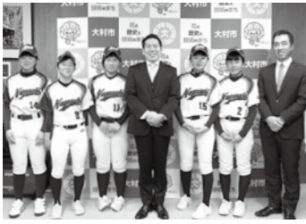
📅 3/13 第13回都道府県対抗全日本中学生女子ソフトボール大会(東京都)に県選抜チームとして出場した選手の皆さん