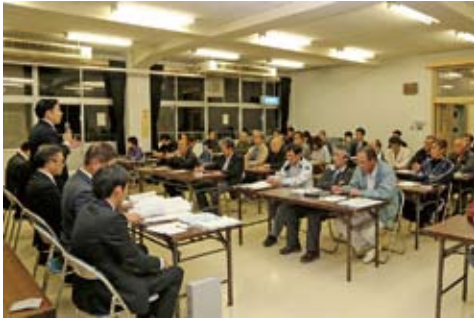
←多数のご参加ありがとうございました

新 市庁舎の候補地として現地周辺を選定。市民の皆さんに理解を深めていただこうと、意見交換会を市内8地区で開催しました。三浦住民センターを皮切りに各地区で市民の皆さんと意見交換。いただいたご意見は、市庁舎建設の参考とさせていただきます。