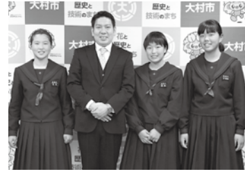
📅 3/14 第28回都道府県対抗全日本中学生ソフトテニス大会(三重県)に県選抜チームとして出場した選手の皆さん