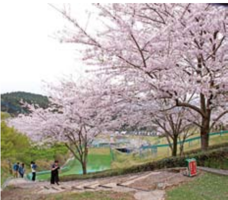
↓琴平スカイパーク