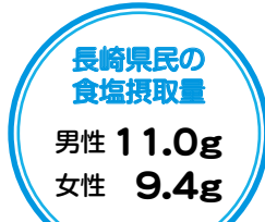
H23 長崎県健康・栄養調査より

食品のナトリウム量をしっかりチェックしましょう。食塩は、ナトリウムの約2.5倍に相当します。たとえば、食品1人分にナトリウムが200mg含まれていれば、食塩相当量は 200\text{mg} \times 2.54 = 508\text{mg} (0.5g) です。