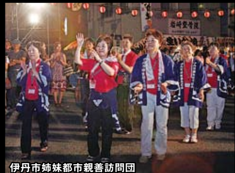
伊丹市姉妹都市親善訪問団