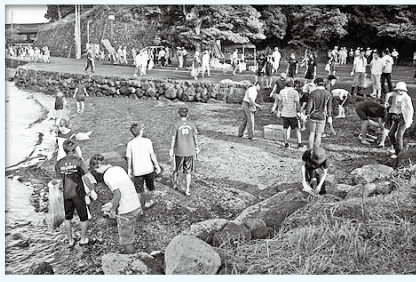
■大村湾をきれいにする会大村支部 (事務局 環境保全課 内線143)

※郡川河口周辺の沿岸を清掃します。 ○駐車場は郡大橋南側の市総合運動公園予定地をご利用ください。