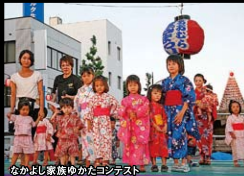
なかよし家族ゆかたコジテスト