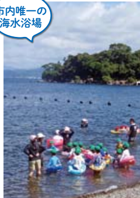
市内唯一の 海水浴場