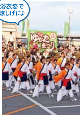
浴衣姿で 涼しげに!