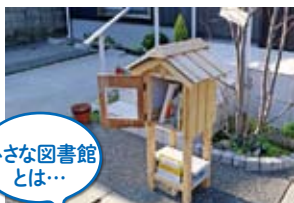
小さな図書館とは…

海フェスタ大村湾以外にも、大村ではさまざまな夏休み、を楽しめますよ。夏休みの宿題や、夏の思い出づくりに、友だちと一緒に参加してみませんか。