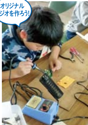
オリジナル ラジオを作ろう!