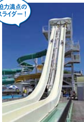
迫力満点の スライダー!