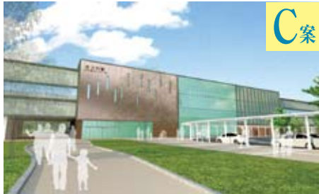
「波のゆらぎと木漏れ日がつなぐ駅」