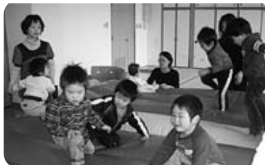
3歳以上児のお部屋(エアーマットで遊ぶ)