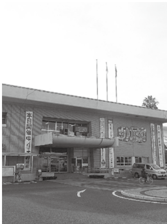
■ 人事課 (内線 271)

※試験案内や申込書は、担当課、各出張所および市のホームページから入手できます。 ※詳しくは、試験案内をご覧ください。