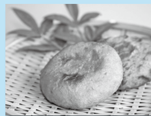
昔から子どものおやつとして親しまれてきました