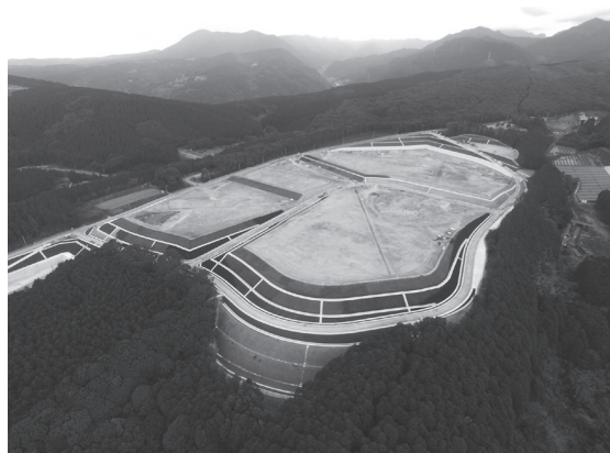
▲雄ヶ原町に整備した新工業団地。

幹線道路：幅員9メートル(うち歩道2メートル) 給水：市上水道・工業用水道 排水：市公共下水道 電力・通信：九州電力・NTT西日本