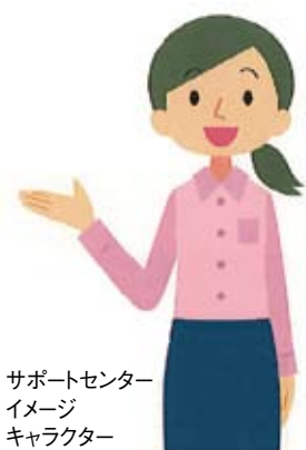
サポートセンター イメージ キャラクター

「大村在宅ドクターネット」を活用して、ご自宅での療養を希望する人と、訪問診療が可能な医師をつなぎます。