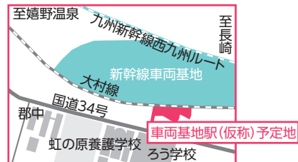
▲車両基地駅(仮称)位置図

■新幹線まちづくり課(内線159) 『世界へ、そして未来につながる・緑と歴史の大舞台 新大村』を、まちづくりのテーマに整備を進めている、JR大村線(松原・竹松間)車両基地駅(仮称)のデザイン案ができました。皆さんの投票でデザインが決まりますので、ぜひ投票をお願いします。