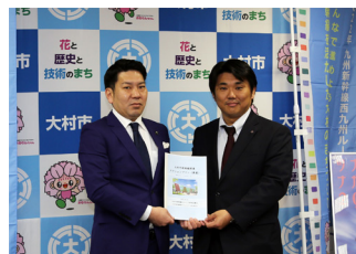
▲委員長から素案が提出されました(2月8日)

■新幹線まちづくり課(内線601) 新幹線の開業効果を最大とするために、官民一体となって取り組む「大村市新幹線開業アクションプラン」への皆様のご意見をお待ちしています。本プランは、大村商工会議所青年部を中心とした策定委員会が素案を策定し、開業に向けたおもてなしなどを盛り込んでいます。