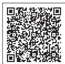
▲新幹線に関する情報はこちらから