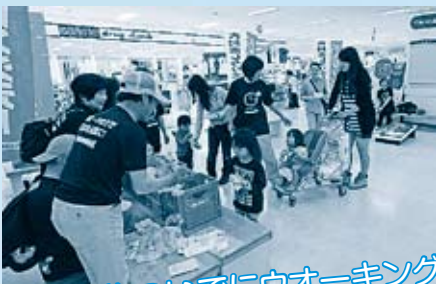
買い物ついでにウォーキング