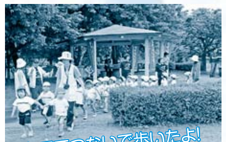
おてつないで歩いたよ!

世界中で同時に開催されるスポーツイベント「チャレンジデー2011」が全国一斉に開催されました。今年も、東日本大震災の発生により従来の対戦形式を取りやめ、スポーツの力で被災地の皆さんを勇気づけられるようなチャレンジデーを実施しました。 大村市は参加率59%で、見事4年連続の金メダル(参加率50%以上)を獲得しました。学校、職場、グループ、家族、個人など多数ご参加いただきありがとうございます。