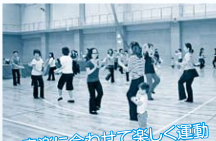
音楽に合わせて楽しく運動

来年も「チャレンジデー2012」に参加する予定です。皆さまのより一層のご協力をよろしくお願いいたします。 ■スポーツ振興室(内線187)