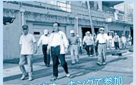
市長もウォーキングで参加