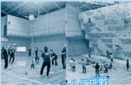
玉入れ・ウォールに挑戦