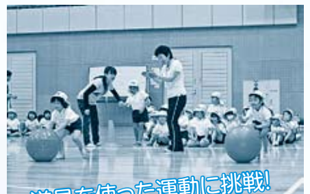
道具を使った運動に挑戦!