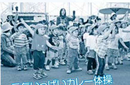
元気いっぱいカレー体操