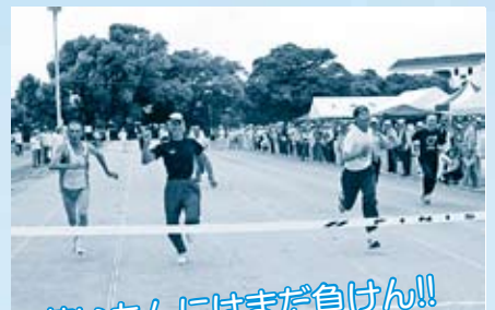
若いもんにはまだ負けん!!