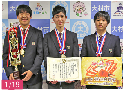
全国高校生食育王選手権大会(福井県)で優勝された、向陽高校調理科2年生の選手の皆さん。