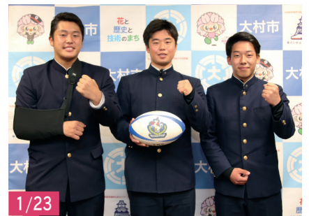
全国高等学校ラグビーフットボール大会(大阪府)に出場された、本市在住で長崎北陽台高校ラグビー部の選手の皆さん。