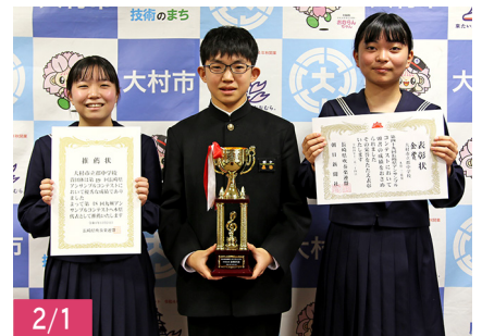
九州アンサンブルコンテスト(沖縄県)に出場される、郡中学校吹奏楽部木管三重奏の皆さん。