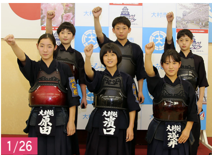
文部科学大臣杯全国選抜少年剣道錬成大会(茨城県)に出場される、大村市剣道協会の選手の皆さん。