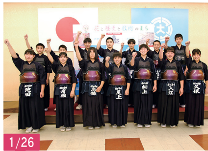
白龍旗争奪中学生選抜剣道大会(熊本県)に出場される、桜が原中学校女子剣道部と玖島中学校男子剣道部の選手の皆さん。