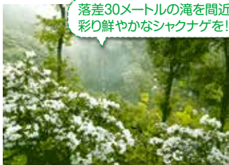
落差30メートルの滝を間近に、 彩り鮮やかなしゃくなげを!!

とき 4月2日(土)～5月5日(木)祝 ところ 裏見の滝自然花苑(立福寺町) 入場料 200円(未就学児は無料) 開園時間 午前9時～午後5時