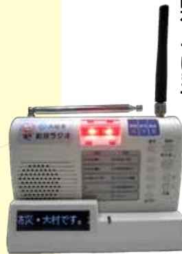
← 文字表示機能付防災ラジオ

そのほか、市内の公共施設、学校、福祉施設、児童施設、医療機関、公共交通機関などにも防災ラジオを配布しています。