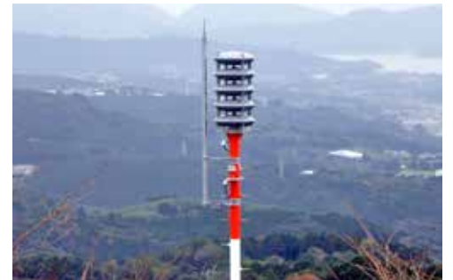
↑ 全方位型スピーカー

市では、自然災害などから市民の生命、財産を守るため、防災情報や火災情報、行政情報などを速やかに市民の皆さんにお伝えする、防災行政無線を整備しました。4月1日から、この運用を開始します。