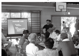
【自主防災訓練の様子】