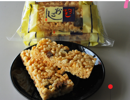
おこし「へこはずし」

創業は延宝7年、伝統のおこし 330年以上の歴史を誇る大村を代表する銘菓。硬すぎずに食べやすいおこし。