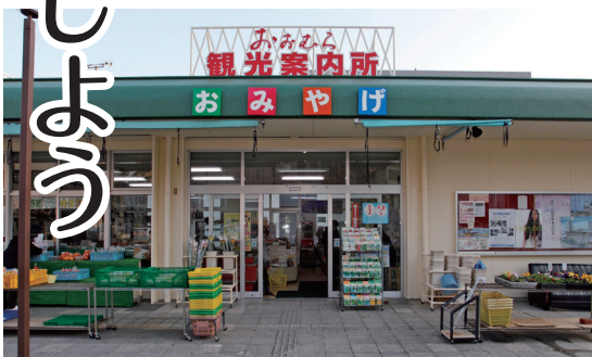
JR 大村駅前にある観光案内所