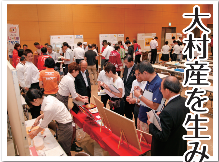
イベント会場の様子

「じげたま」とは、地元のもの（者）「じげもん」と、これから生まれる特産品「たまご」の2つを合わせて作った言葉です。「じげたまグランプリ」は、地域に愛される大村発の新品を生み出すため、2年ごとに開催されているイベントです。市民審査により、最優秀賞商品などを決定し表彰します。これまでにも、さまざまな新商品が誕生し、その多くがお店の看板商品として、販売されています。