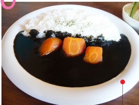
大村あま辛黒カレー