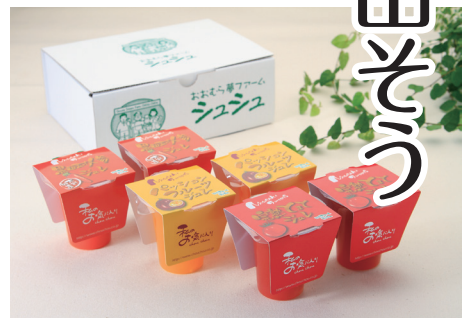
前回の最優秀賞商品「完熟とまとジュレ」