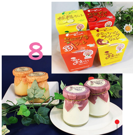
シュシュオリジナルスイーツセット

創業は延宝7年、伝統のおこし 330年以上の歴史を誇る大村を代表する銘菓。硬すぎずに食べやすいおこし。