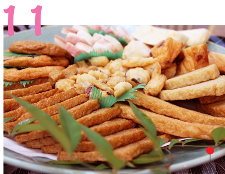
かまぼこ詰め合わせ

大村特産の黒田五寸人参で彩りを添え、大村の歴史を感じさせるご当地グルメ。B-1 グランプリにも出品。