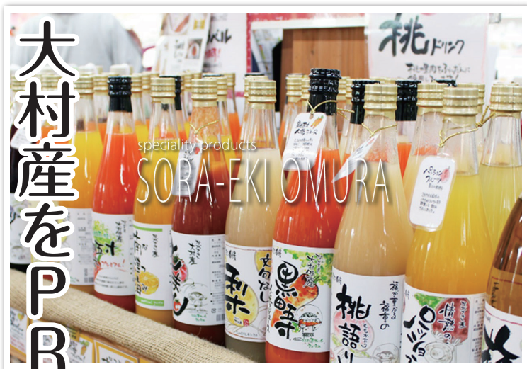
「そらえきおおむら」のホームページ