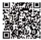
県公式モバイルサイト

県では、さまざまな防災情報を提供しています。インターネットで検索してみましょう。