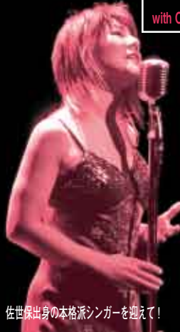
佐世保出身の本格派シンガーを迎えて!