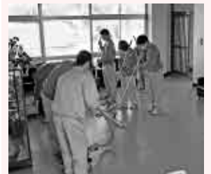
県立虹の原特別支援学校の生徒(2・3年生11人)に、奉仕の課外授業の一環として、竹松住民センターの会議室床や窓などの清掃作業をしていただきました。(1月17日)