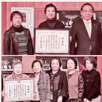
厚生労働大臣感謝状表彰

永年にわたりボランティア活動を率先して行われたとして、ききょうグループ(上)とボランティアグループ松葉会(下)が受賞されました。