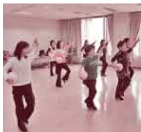
ステップ21体操(市コミセン)

毎月最終水曜日を「マイ・チャレンジデー」として、それぞれのペースで1日15分以上の健康づくり運動にチャレンジしましょう!!