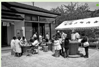
地元で作られた特産品を公民館前で販売しています。