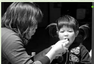
1周年を迎えたこの日、来客者には、しし汁が振る舞われました。