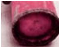
溶接部および周辺がはがれている