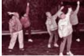
11月のようす(坂口公民館)

■地域げんき課スポーツ振興室内 大村市チャレンジデー実行委員会事務局(内線188)