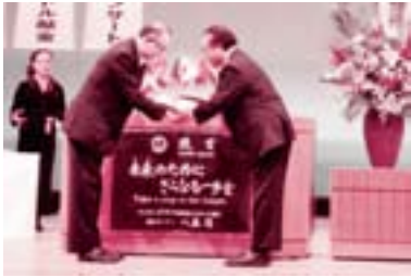
ライオンズクラブ国際協会大村ライオンズクラブから、市内小学校 15 校に図書を送贈していただきました。(11月3日)