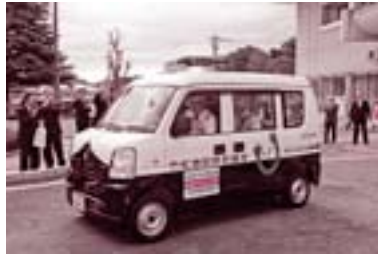
日本財団から、青パト配備事業の助成により、竹松地区防犯協会へ地区防犯活動用青色回転灯付きパトロール軽自動車1台を送贈していただきました。(11月11日)