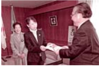
国際ソロプチミスト大村から、市立図書館に女性関係図書を送贈していただきました。(11月27日)