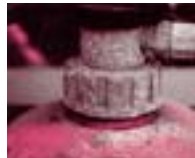
表面にポツポツができています