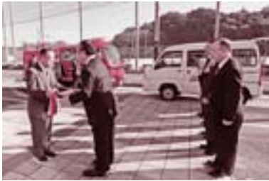
空港環境整備協会から、空港周辺地域の消防体制のより一層の充実を図るため、公園管理用軽自動車の送贈と、第13分団消防車両の助成をしていただきました。(11月18日)