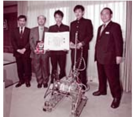
神奈川県で開催された第17回全国高等学校ロボコン競技大会で準優勝し、技術奨励賞・経済産業大臣賞にも輝いた県立大村工業高校の電気通信部の皆さんと、「銀太郎改(カスタム)」。(12月8日)