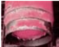
サビを落としても腐食が残っている