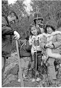
平成19年度に助成を受けた「すずた1000本桜公園づくり事業」

※要綱・提出書類は市ホームページからダウンロードできます。 ※詳しくはお問い合わせください。