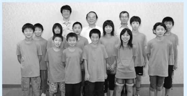
平成20年度全日本少年武道(剣道)錬成大会に出場した大村市剣道協会チームと微神堂チームの皆さん(7月18日)