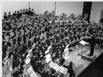
世代を超えた総勢400人による迫力のコンサート