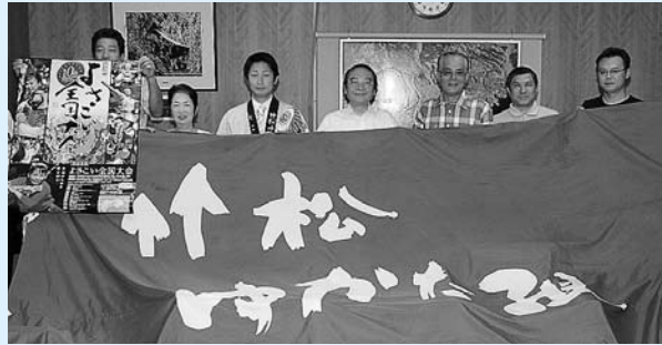
第10回よさこい全国大会(高知県高知市)に出場したDocoSoy竹松ゆかた組の皆さん(7月31日)