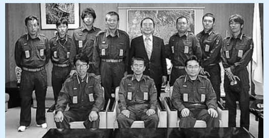
第29回長崎県消防ポンプ操法大会で敢闘賞を受賞した大村市消防団第11・12分団合同チームの皆さん(8月8日)