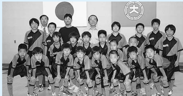
平成20年度全国小学生ドッジボール選手権大会に出場した旭フェニックスの皆さん(8月8日)