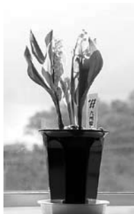
か所せま 業さき 営ださ 村感だ 大をいた 電力をい 九州の訪 ら春ズラ スた。(2月14日)