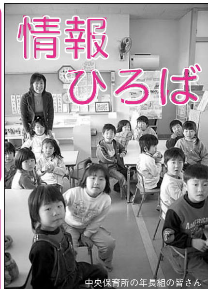
中央保育所の年長組の皆さん