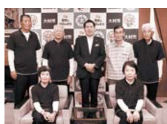
📅 8/29 全日本ゲートボール選手権大会(北海道)に出場した福重ゲートボールクラブの皆さん