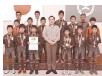
📅 8/16 全日本少年フットサル大会(東京都)に出場したキックスフットボールクラブU-12の皆さん