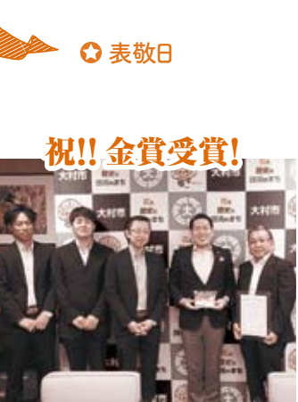
📅 8/24 「2017九州・沖縄地区豆腐品評会」(熊本県)の充填豆腐部門で、九一庵食品協業組合の「濃くコク豆腐」が見事金賞を受賞しました。