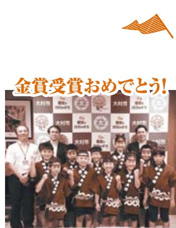
📅 8/29 全国の小規模小学校を対象にした「小さな音楽会コンクール」(東京都)で、黒木小の黒木太鼓が、見事最優秀の金賞に輝きました。