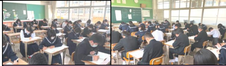
全国学力・学習状況調査を受ける3年生(右) 長崎県学力調査を受ける2年生(左)

郡中学校では、生徒一人一人の自己実現に向けた資質・能力を育てていくために、日々の授業実践にしっかりと努めてまいります。ご家庭におかれましても家庭学習の習慣化のため、生徒達への温かい声かけと見守りをよろしくお願いします。