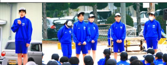
生徒会長挨拶、生徒会役員紹介で歓迎遠足がスタートしました。生徒会役員の成長が光りました。