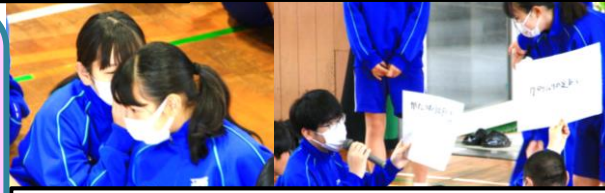
いつの時代も伝言ゲームは盛り上がります。各クラスの最終生徒の答え合わせはとても面白く、大爆笑でした!