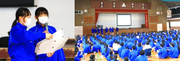
プロジェクターを用いた大画面によるクイズ大会。先生方の話題を面白おかしく紹介してくれました。