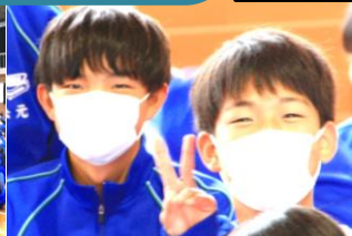
生徒会役員の頑張りでも楽しい時間を過ごすことができ、緊張もほぐれ、笑顔も増えました。そして、歓迎遠足の最後はクラス全員での記念撮影でした!