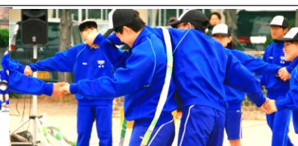
手を離さないフラフープくぐりは、なかなかの難敵です。逆に絆は深まります。