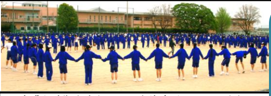
多感な時期を迎えている生徒達が心一つに手をつなぎ合う姿。令和5年度のチーム郡のスタートです!