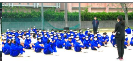
縦割りブロック初の顔合わせ。結束を固めて、今後の体育大会練習につなげていきます。