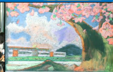
美術部伝統の歓迎黒板アート！