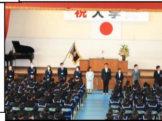
吹奏楽部からの歓迎の演奏です！