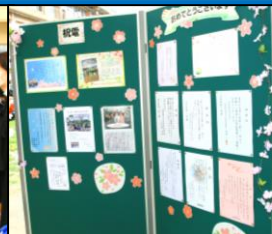
祝電のお披露目です！