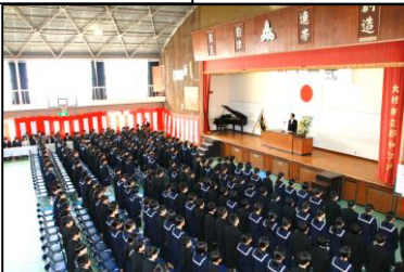
234名の入学を許可します！