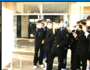
いよいよクラス発表です！