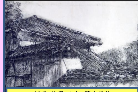
版画 特選 3年 勝木里仲