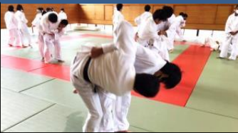
体育では、1・2年生必修の「柔道」の授業を安全面にしっかりと配慮して行っています。柔道着姿がとても凛々しいです。