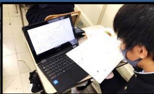
1年家庭科では、「冬の旬の食材」を用いた献立作りを学んでいます。ここでも、タブレットが活用されていました。

今年も早いもので、残り2週間あまりとなりました。生徒の挨拶や授業中の態度等、危惧したところもありましたが、その都度、先生方の指導で立て直しを図り、充実した教育活動の展開に向けて努めてきました。「歩みを止めない教育」の中で、引き続き、生徒達の良き変容を育てていきたいと思えます。保護者の皆様におかれましては、今後とも、ご理解とご協力をよろしくお願い致します。